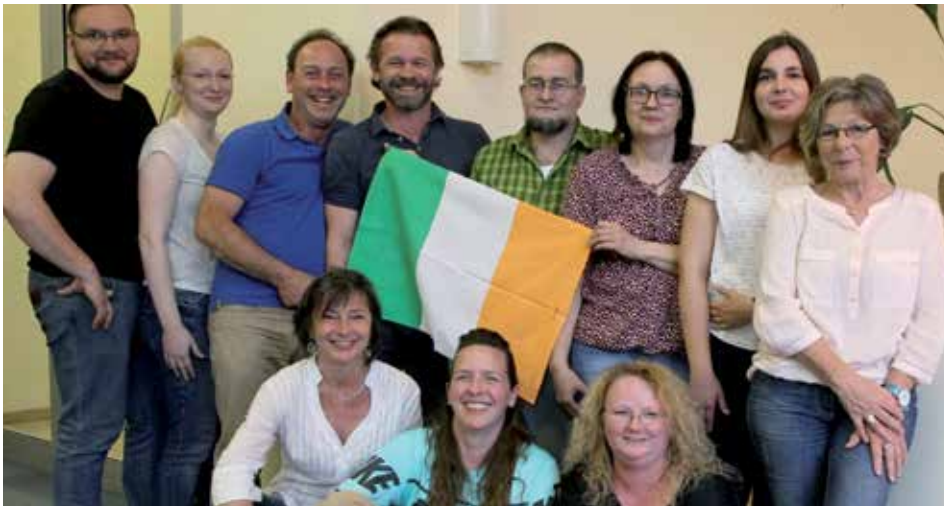
Die Gruppe „Set Dance Augsburg-Steppach“ lädt ein zum Mitmachen