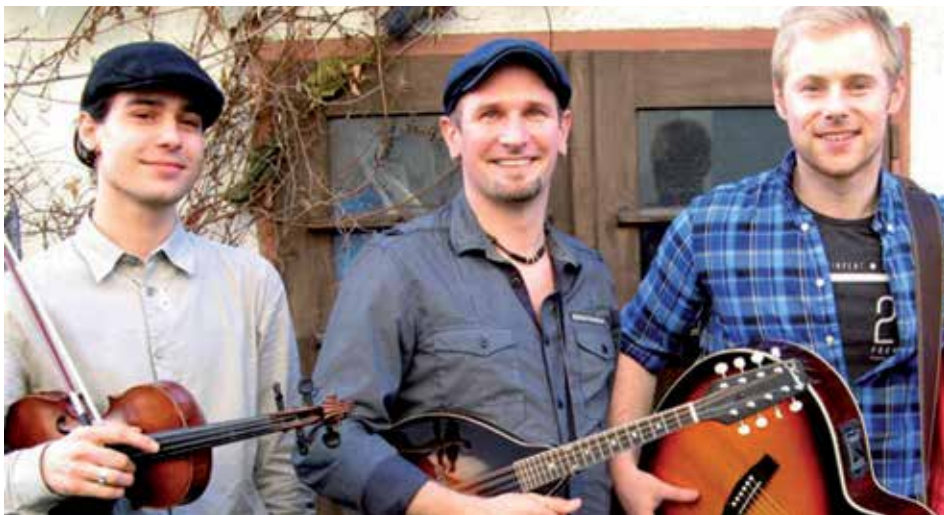
Die Band „Attila and Friends“ begleiten den Irischen Abend