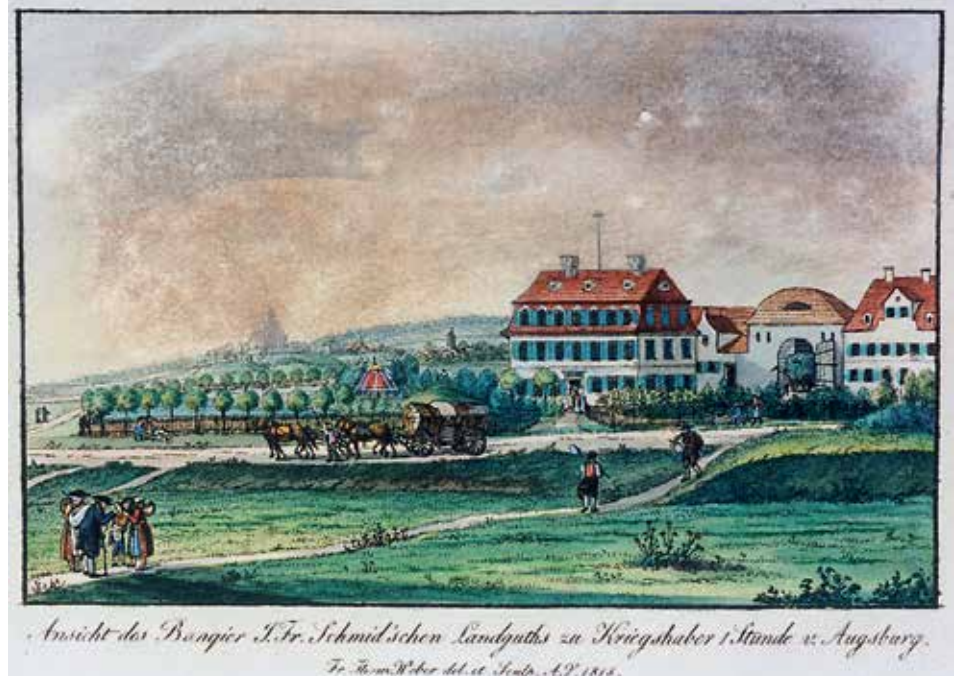
Das Kriegshaberer Landgut, Gemälde aus der Zeit um 1818.

Seitdem hängt es wieder dort, wo es hingehört. Im Franzosenhof! ■