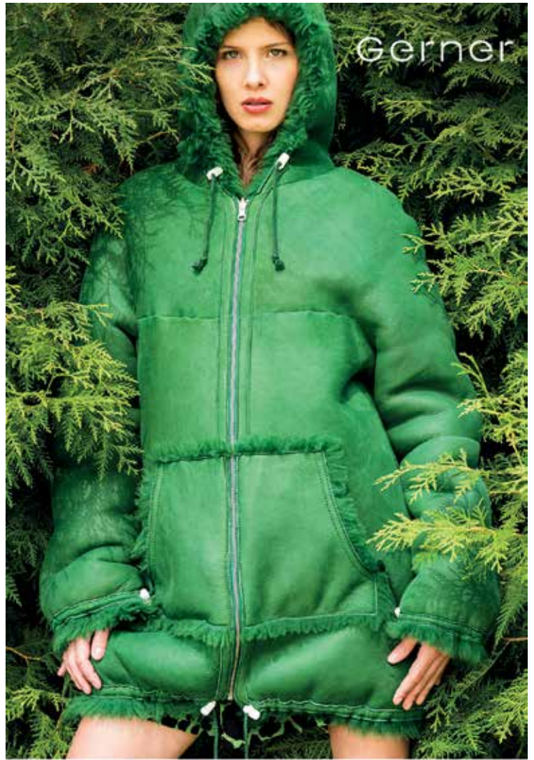
ulmer straße 152 - tel. 0821/40 77 73 - www.pelz-gerner.de

Das wünschen sich alle Eltern in der Erziehung der Kinder: immer ruhig und gelassen zu bleiben, Konflikte zu entschärfen und zugleich sein Kind stärken. Das Konzept der Elternschule „KESS-erziehen“ wurde für den Familienalltag entwickelt. KESS steht für ein kooperatives Familienklima, ermutigen des Kindes, soziale Bedürfnisse wahrnehmen und situationsorientiert erziehen. Der Kurs richtet sich an Eltern von Kindern zwischen 3 und 11 Jahren. An 5 Abenden jeweils donnerstags, ab dem 12.04.2018 (nicht am 10.05.), jeweils von 19.30 Uhr bis 21.45 Uhr werden praxisnah die Inhalte des Kurses vermittelt. Der Elternkurs findet im Pfarrheim Heiligste Dreifaltigkeit, Ulmer Str. 195 in 86156 Augsburg-Kriegshaber statt. Die Teilnahmekosten für den Kurs betragen 40 Euro pro Teilnehmer, bzw. 60 Euro für Paare. Weitere Informationen und Anmeldung bei der Kolpingsfamilie Augsburg-Kriegshaber, Barbara Säckl, Tel: (08 21) 3 44 31 33.