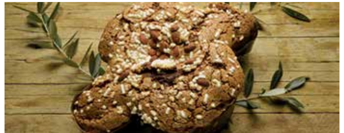
Die „Colomba pasquale“, die Ostertaube