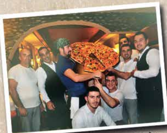
Unser Original - gut, groß & günstig

..... Wir freuen uns sehr, Sie als Gäste in unseren Restaurants begrüßen zu dürfen.