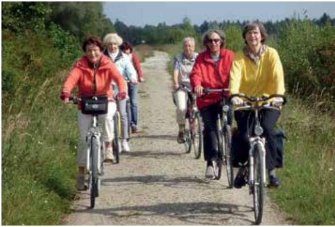
Pilgertag Jakobsweg in Bobingen