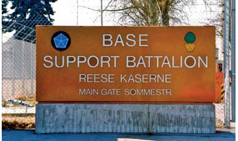
Haupteingang an der damaligen Reese Kaserne in der Sommestraße

Originaltext zur Belobigung: Für hervorragende Tapferkeit und Todesverachtung weit hinaus über die Pflichterfüllung im Dienst unter tatsächlicher Feindberührung. Als der Feind einen Gegenangriff führte, der die Stellung seiner Kompanie gefährdete, verlegte der Gefreite Reese, indem als amtierender Zugführer eines 60 mm-Mörser-Zuges von sich aus überragende Führungsqualitäten zeigte, seinen Zug vorwärts in eine günstige Stellung, aus der er durch geschickte Leitung des Feuers seiner Waffe große Verluste in den feindlichen Reihen verursachte und damit wesentlich dazu beitrug, den Gegenangriff zurückzuschlagen. Als das feindliche Feuer so heftig wurde, dass es seine Position unhaltbar machte, befahl er den anderen Mitgliedern seines Zuges, sich in eine sicherere Stellung zurückzuziehen, lehnte es jedoch ab, sich selbst in Sicherheit zu bringen. Um dem Feind noch wirkungsvoller unter Feuer nehmen zu können, brachte der Gefreite Reese seinen Mörser ganz allein in eine neue Stellung und griff ein feindliches Maschinengewehrnest an. Er hatte nur für drei Salven Munition, landete aber mit der letzten Salve einen Volltreffer, zerstörte und seine Besatzung tötete.