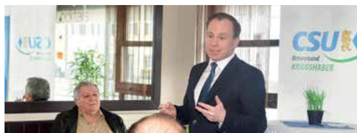
Volker Ullrich stellt sich den Fragen der Gäste