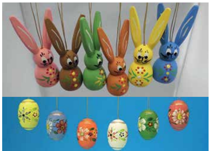
Holz-Osterhasen und Ostereier aus Seiffen im Erzgebirge