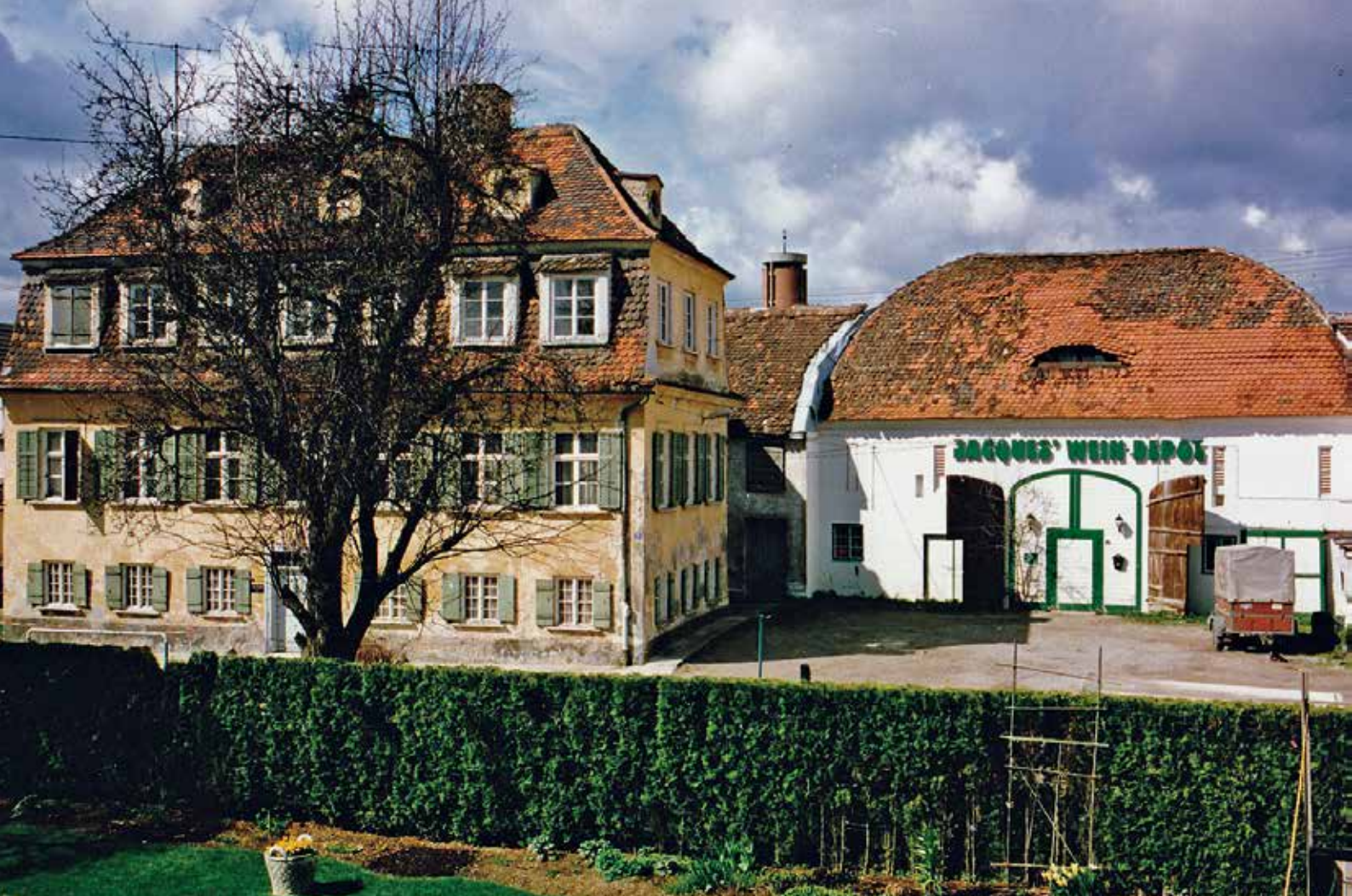
Der Franzosenhof vor 2002 (Das Herrenhaus ist, wie man sieht, noch nicht renoviert).