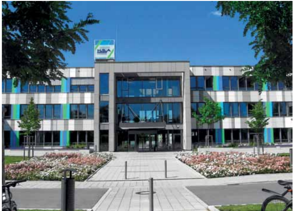
Das bunte Haus nahe der Grenze nach Pfersee bietet Platz für alle fünf Schulen der Akademie, vom Realschüler in der fünften Klasse bis zum gestandenen Facharbeiter auf seinem Weg zum staatlich geprüften Techniker.

An der Wirtschaftsschule können die Schülerinnen und Schüler ebenso die Mittlere Reife erlangen. Dies eröffnet den Absolventen anschließend bessere Chancen für eine qualifizierte Ausbildung, wie zum Beispiel an den IT-Berufsfachschulen der HSA.