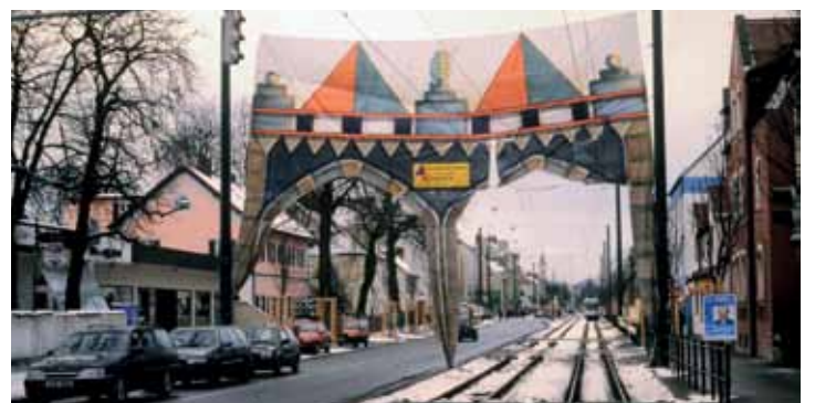
Das „Jubiläumstor“ 1996 an der ehemaligen Haltestelle „Heimgarten“: 80 Jahre Stadtteil von Augsburg, 86 Jahre Straßenbahn nach Kriegshaber