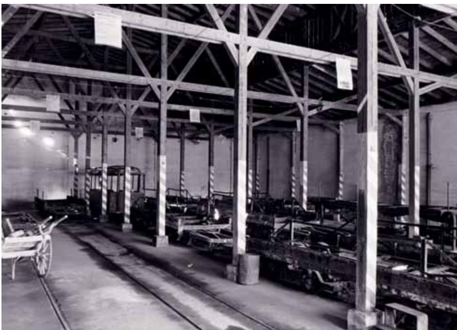
Ausgebombte Fahrgestelle warten auf ihre Wiederverwendung (1944).

Obwohl die Halle den zweiten Weltkrieg weitgehend unversehrt überstanden hatte, stand sie später, im Jahr 1987, kurz vor dem Abbruch. Nachdem bereits 1985 ein Triebwagen beim Rangieren das Mauerwerk der Rückwand beschädigt hatte, durchbrach im November 1987 erneut ein Straßenbahnwagen die hintere Wand. Diesmal musste die gesamte Rückwand abgetragen werden, das Gebäude drohte instabil zu werden. Der drohende Abriss konnte nur durch erhebliche Stabilisierungs- und Verstärkungsmaßnahmen verhindert werden.