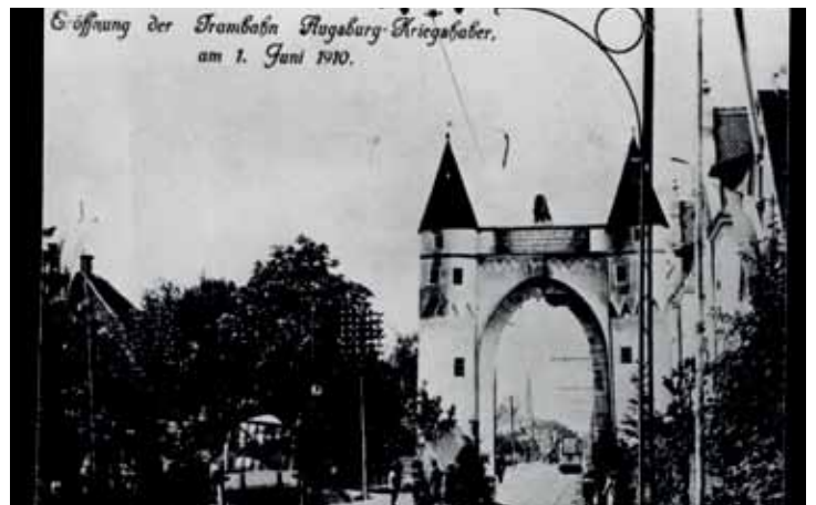
Durch dieses riesige, eigens zu diesem Anlass errichtete „Stadttor“ rollte der erste Wagen nach Kriegshaber