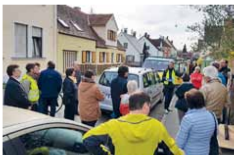
Zahlreiche Teilnehmer versammelten sich in der Maienstraße

Am 13.04.2018 fand der Auftaktspaziergang im Stadtteil Kriegshaber statt,