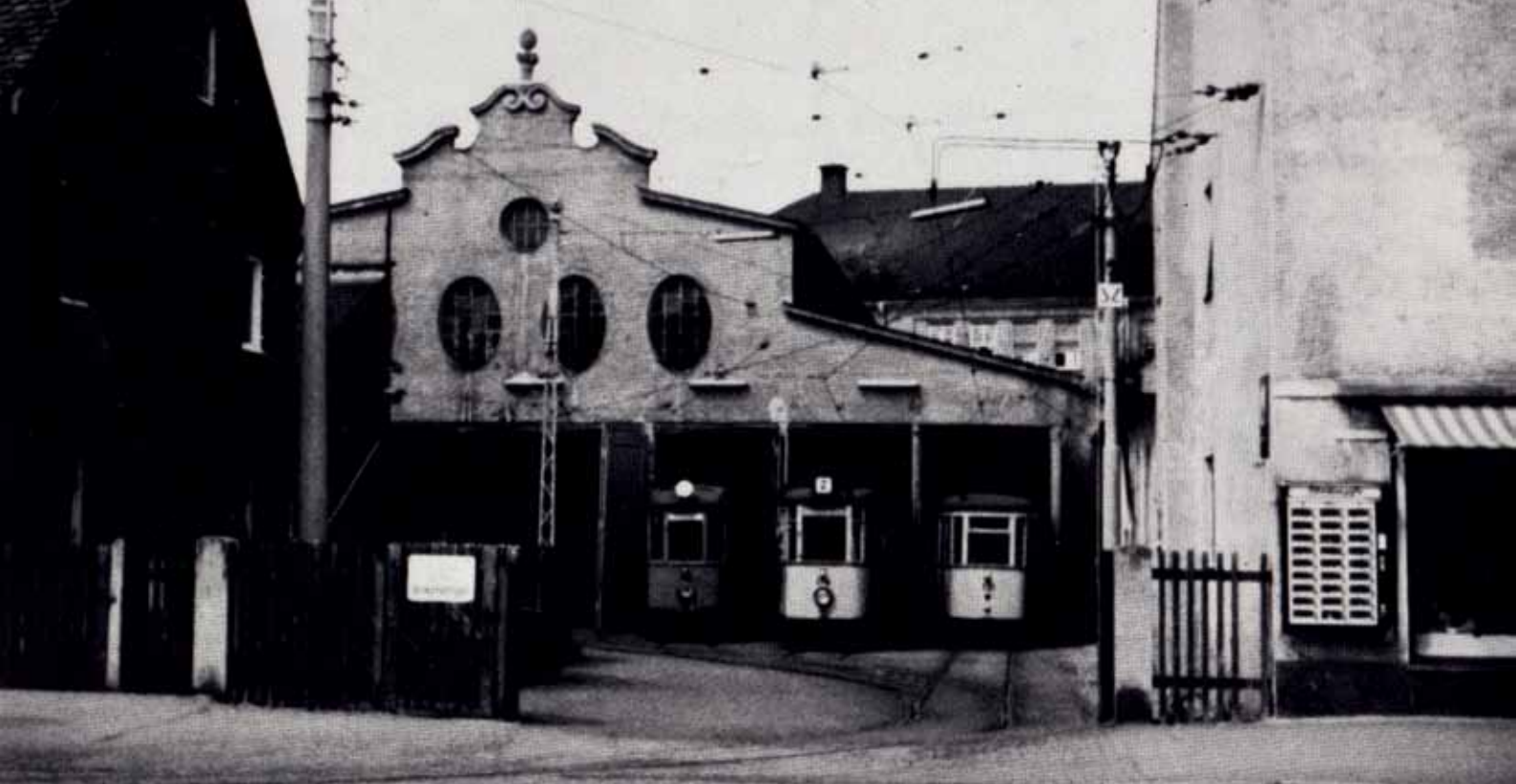
1960: Zwei Triebwägen und ein Beiwagen warten auf ihren Einsatz.

der aber mit dem Ende der Nutzung als Wendepunkt wieder geschlossen wurde.