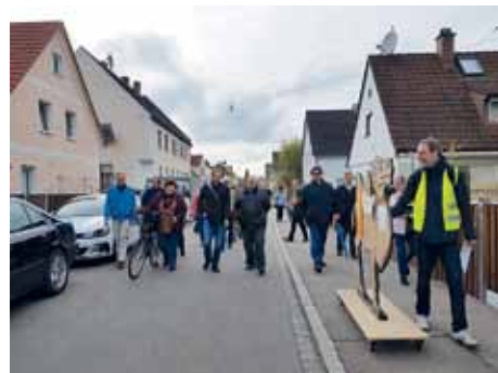
Die Energiekarawane zieht durch Kriegshaber's Straßen

Bei Interesse an einer Energieberatung durch die Stadt Augsburg können Sie sich unter augsburg.de/energiesparen informieren. ■