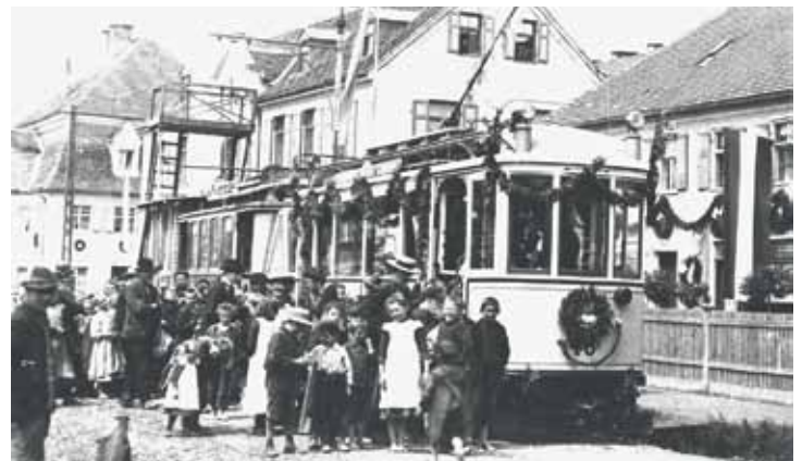
Begeisterter Empfang der ersten Straßenbahn in Kriegshaber am 1.6.1910

Im Jahr 1996 – zum 80-jährigen Jubiläum der Eingemeindung Kriegshabers nach Augsburg – durchfuhr die inzwischen zweigleisige Bahn wieder um ein „Willkommens-Tor“.