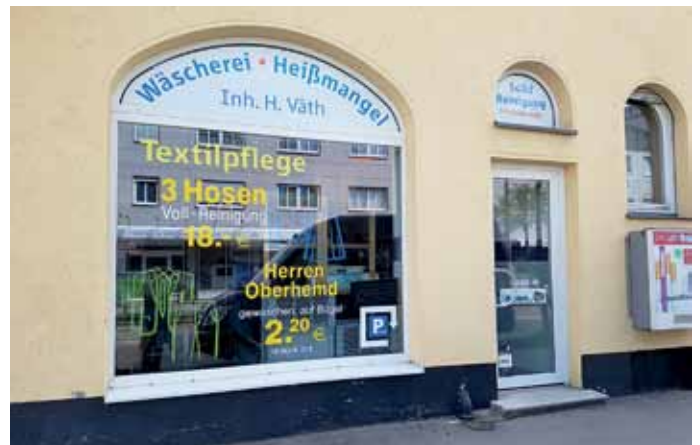
Wäscherei & Heißmangel Väth an der Ulmer Straße