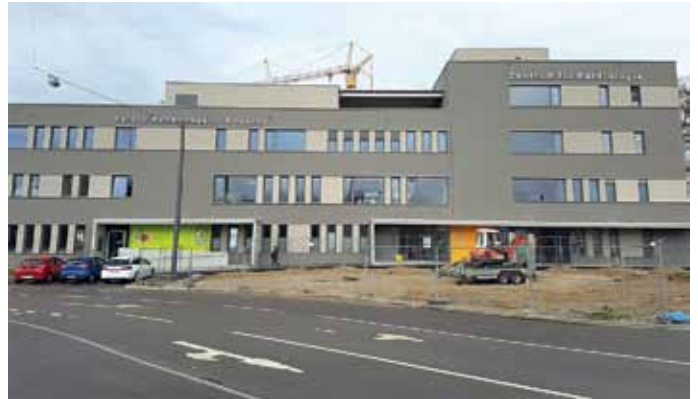
Das neue Zentrum für Kardiologie in der Alfred-Nobel-Straße.