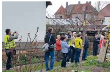
Besuch eines Hauseigentümers