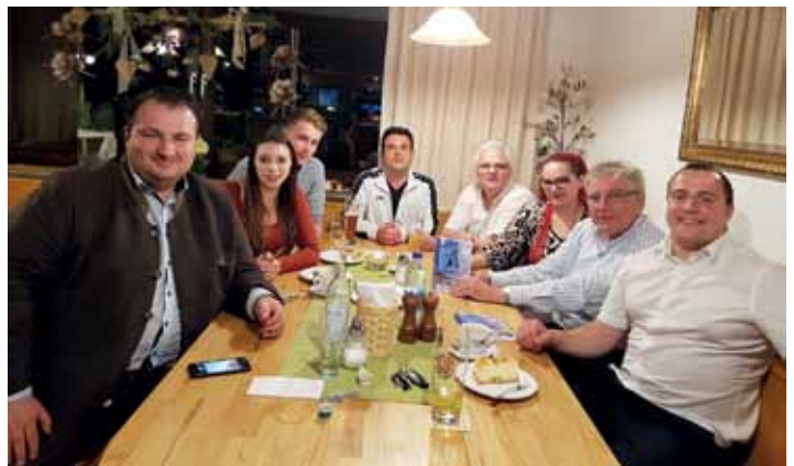
Gemeinsames Kuchenessen in der Gaststätte TSV Kriegshaber