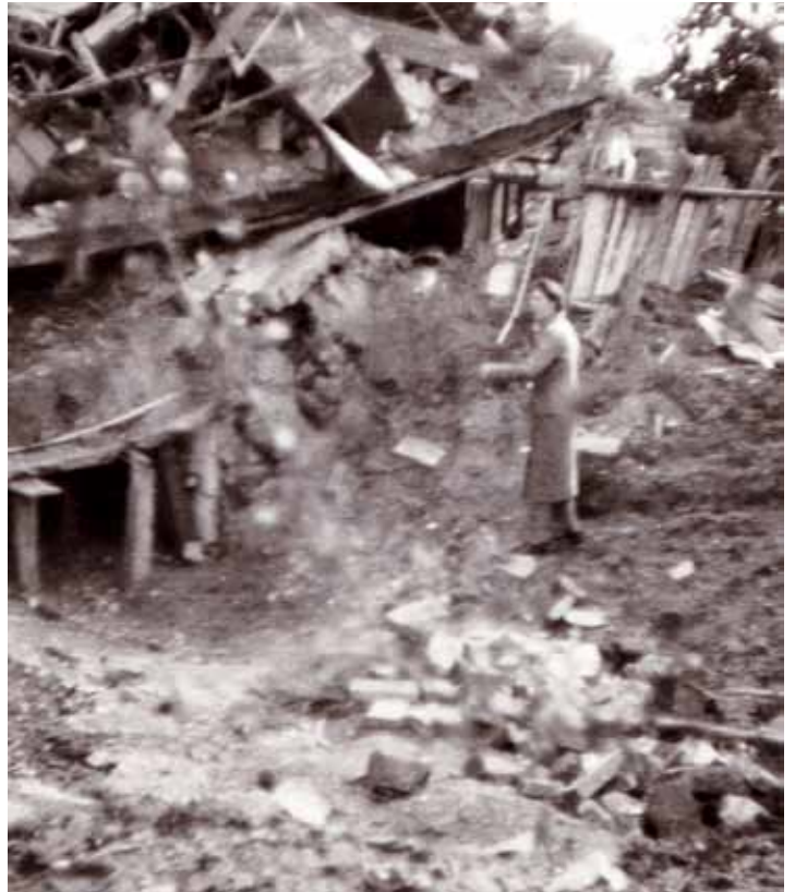
Die Menschen stehen verzweifelt und fassungslos vor ihren zerstörten Häusern, wie hier in der Hummel- und Maienstraße