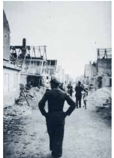
Auch die kleinen Häuser der Osterfeldstraße wurden schwer getroffen, wie die Bilder zeigen.