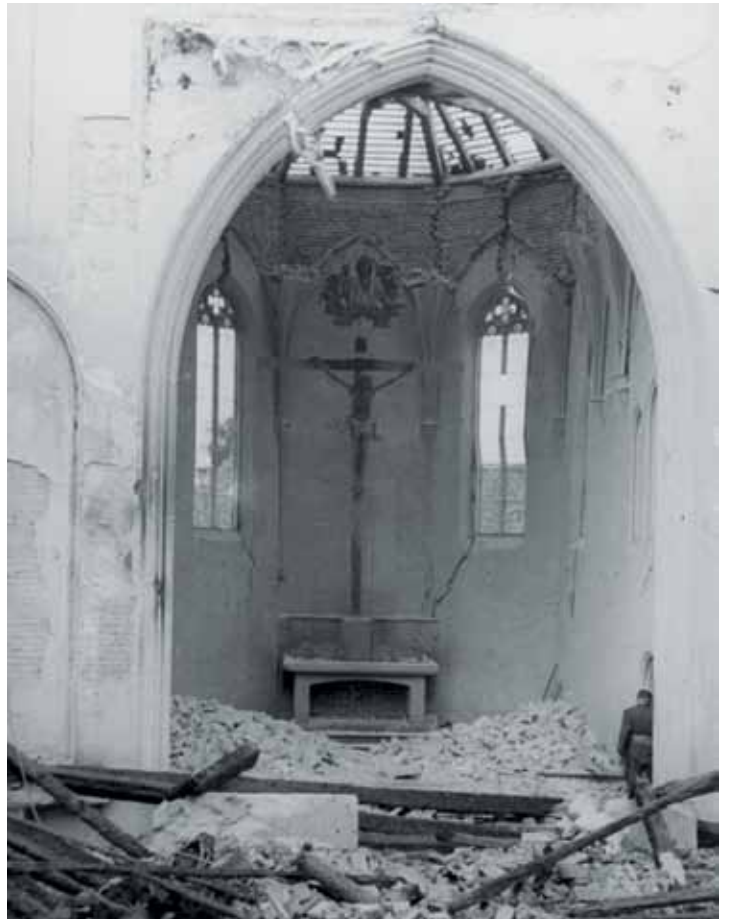
Die „Innenansicht“ der durch eine Brandbombe zerstörten Kirche „Hl. Dreifaltigkeit“. Wie durch ein Wunder blieb der Ostchor mit dem großen Kreuzifix erhalten.

St. Thaddäus: der Bau dieser Kirche wurde im März 1939 begonnen. Bereits 1940 musste der Bau vorübergehend eingestellt werden. Unser Bild zeigt den Zustand 1941. Dass 1942 überhaupt weiter gebaut werden durfte, lag daran, dass die Unterkirche dringend als Luftschutzraum benötigt wurde und die Türme als Flakstellungen dienten. Zeitweilig waren sogar Teile der Rüstungsproduktion von Keller Knappich in den Rohbau der Kirche ausgelagert. Erst 1948 konnte die Kirche fertiggestellt und geweiht werden.