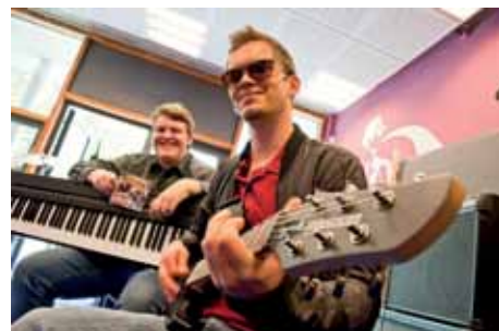
Klavier, Gitarre, Gesang: Mehr braucht das Duo „Shots“ nicht, um gute Musik zu machen.

Für die eintrittsfreien Veranstaltungen bedarf es zwar keiner Anmeldung, eine Reservierung wird auf Grund der begrenzten Plätze aber allemal empfohlen. Reserviert werden kann im Wirtshaus Frau Huber an der Theke oder unter der Nummer 0821/44 80 54 00. Im Internet ist das Programm auf der Seite www.frau-huber.com abzurufen. (andi p.) ■