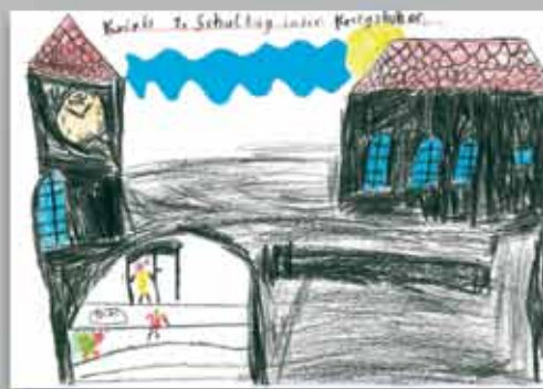
Friedrich (7) malt KRIXI vor dem großen Schulgebäude mit blauen Fenstern und riesiger Schuluhr