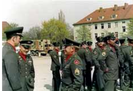
Artilleriesoldaten sammeln sich im feinen Dienstanzug in der Reese Kaserne, 1970er Jahre. *

Nach dem Krieg waren die Kasernen nahezu unbeschädigt. Die Amerikaner sahen jedoch kaum Bedarf, die vielen Wehrmachtskasernen in Deutschland zu verwenden. Deshalb nutzten sie die Arras-Kaserne zu Beginn als Lazarett für deutsche Kriegsgefangene. Erst 1947 erfolgte eine formelle Teilräumung des Lagers durch die Stadt Augsburg. Die nun