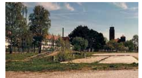
Fahrzeugwaschplatz mit Rampe an der Ulmer Straße, im Hintergrund die St. Thaddäus-Kirche. *