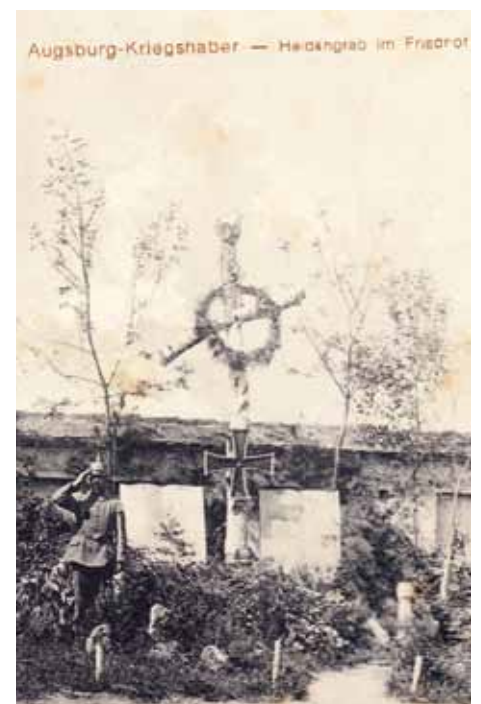
Die 1918 errichtete Helden-Gedenkstätte im Kriegshaberer Friedhof.