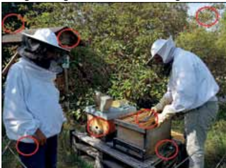
Die Lösung der letzten Ausgabe

Im November wird in Deutschland an das Kriegsende gedacht. Heuer ist es ganze 100