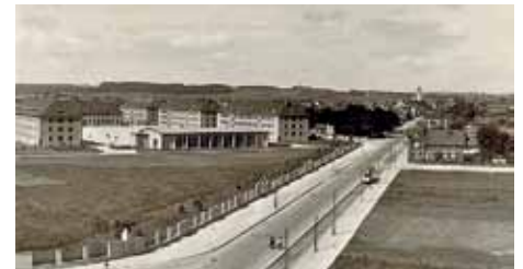
Die nördliche „Reese“ (damals Panzerabwehrkaserne) kurz nach der Erbauung in den späten 30er Jahren. Im Vordergrund die Ulmer Straße in Blickrichtung Kriegshaber. *

vervollständigten die Reese-Militäranlage. Für die Freizeit standen den Soldaten auch ein Tennisplatz und ein Kino im östlichen Teil zur Verfügung. ■