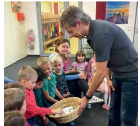
Ziehung der Lose