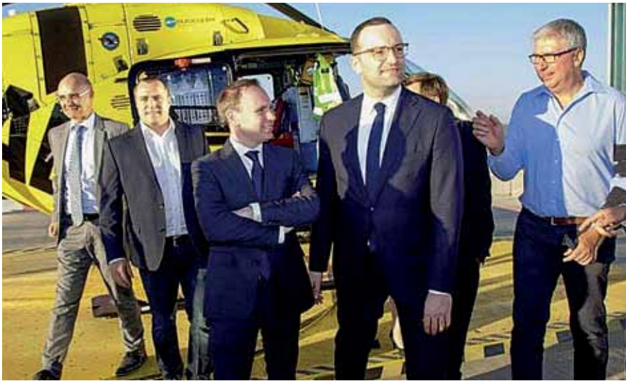
Bundesminister Jens Spahn besichtigt den Rettungshubschrauber „Christoph 40“