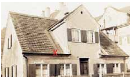
Das Radinger-Haus zum Zeitpunkt der Restaurierung 1980. Das Kreuz kennzeichnet die Stelle, an der die beiden Mörsergranaten gefunden wurden.

„Mein Großvater kehrte im Winter 1918 aus dem Krieg zurück. Eine Kriegserinnerung der besonderen Art hat er damals mitgebracht, von der er uns nie erzählt hat. Im Jahr 1980 baute ich mein Haus um. Bei den Restaurationsarbeiten wurde unter anderem der Fehlboden zwischen Erdgeschoss und dem ersten Stock erneuert. Dabei fielen plötzlich zwei Granaten ins Wohnzimmer. Es waren Mörsergranaten, Kaliber 8,8 oder 10,5; eben diese „Erinnerungen“, die mein Großvater mitgebracht hatte. Da ihm der Fund im wahrsten Sinne des Wortes zu brisant wurde, hatte er ihn zu Beginn des 3. Reiches im Fehlboden versteckt. Nach seinem Tod geriet das „Weltkriegs-Souvenir“ in Vergessenheit. Erst bei der Hausrenovierung kam es wieder zum Vorschein. Hautnah wurde ich so an ein Ereignis erinnert, das mir auf diese Weise in Erinnerung bleiben wird (obwohl ich kein Zeitzeuge bin)“.