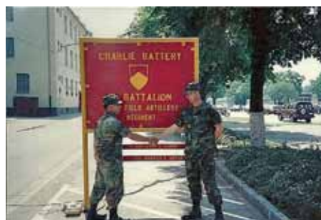
Handschlag von Artilleristen in der Reese Kaserne, 1980er Jahre. *

Zu den wichtigsten Bauwerken zählte der 1971 errichtete stählerne Richtfunkmast. Die Kamäne des Heizwerks, das Barackenlager des Labor Service an der Sommestraße sowie ein Offizierskasino (das spätere Recreation Center, heutiges Kulturhaus abraxas)