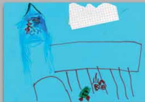
Franziskus (5) zeigt uns KRIXI vor dem Eingang in die Schule