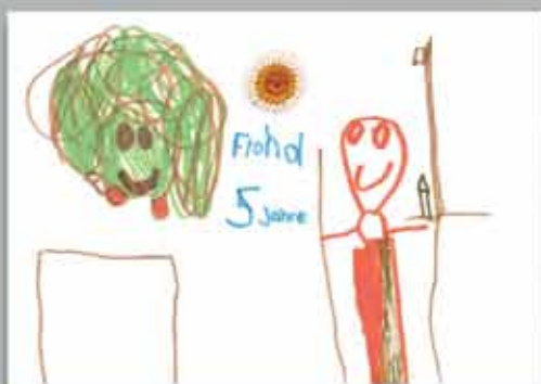
Fiona (5) hat KRIXI beim Unterrichts im Freien gemalt.