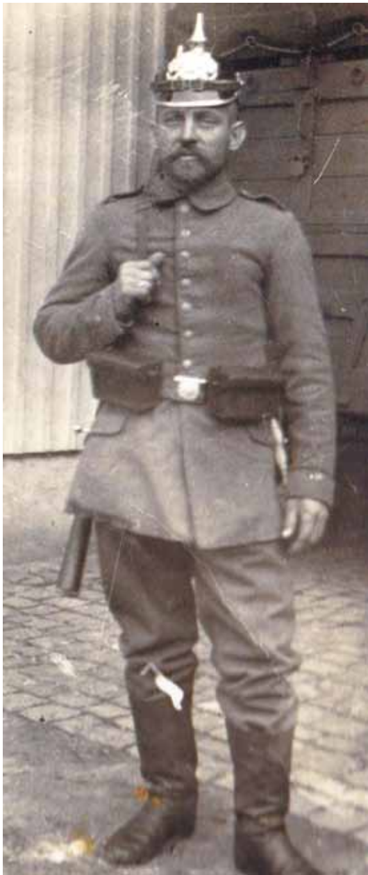
Radinger's Großvater beim Heimaturlaub 1915. ■