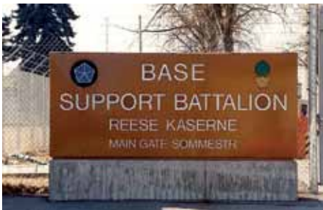
Eingangsschild am Tor der Sommestraße.*

Von 1934 bis 1936 wurden drei Kasernen erbaut: die Arras, die Somme, und die Panzerjäger. Bei den beiden ersten handelte es sich um ehemalige Artilleriekasernen für pferdegezogene Geschütze. Sie bestanden aus vier U-förmigen Gebäudekomplexen mit Sichtmauerwerk und Reithallen sowie Stallungen. Innerhalb der hufeisenförmigen Anlagen gab es Reitwiesen. Die Panzerabwehrkaserne lag