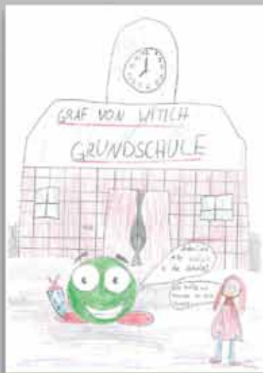
Juliane möchte gerne mit KRIXI zusammen in eine Klasse