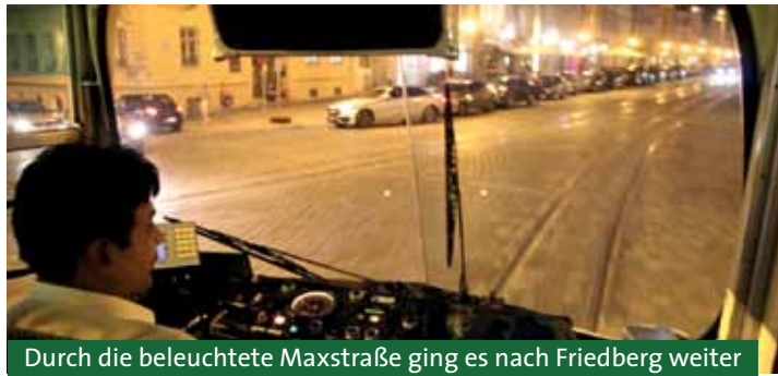
Durch die beleuchtete Maxstraße ging es nach Friedberg weiter

Mit der Straßenbahn ging es auf- und ab durch Augsburg