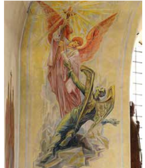
Detail vom Chorbogen (die Vertreibung der gefallenen Engel)