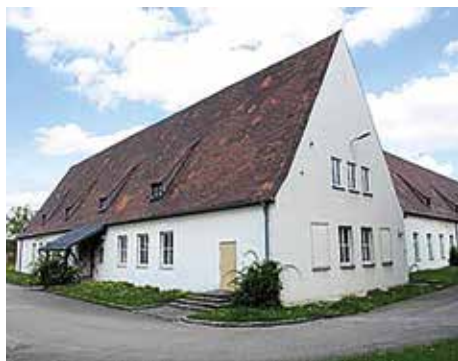
Das Gebäude der Mess Hall von außen.*