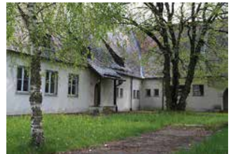
Der Innenhof des Gebäudes.*

Die Flak Kaserne, die ab 1936 gebaut wurde, erhielt im Süden des Geländes ein Stabs- und Kommandanturgebäude. Dieses fiel durch den wuchtigen Säulengang auf der Innenhofseite als markanten baulichen Akzent auf. Das sogenannte „Building 210“ wurde von den Amerikanern später dann als Mess Hall und NCO-Club genutzt. In den 1950er Jahren fanden dort Weihnachtsfeiern mit Bescherungen für bedürftige Augsburger Kinder statt. Das prachtvolle Gebäude stand bis 2008 dort. Dann kamen jedoch die Bagger und rissen den erinnerungsreichen Bau ab.