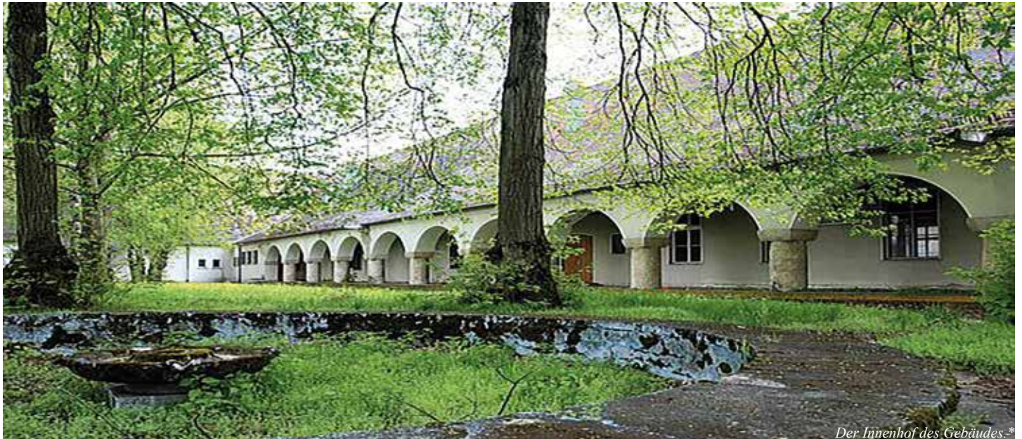
Der Innenhof des Gebäudes.*