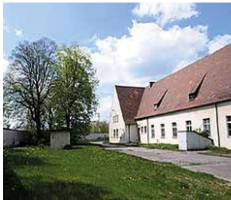
Das Gebäude der Mess Hall von außen.

Die Flak Kaserne, die ab 1936 gebaut wurde, erhielt im Süden des Geländes ein Stabs- und Kommandanturgebäude. Dieses fiel durch den wuchtigen Säulengang auf der Innenhofseite als markanten baulichen Akzent auf. Das sogenannte „Building 210“ wurde von den Amerikanern später dann als Mess Hall und NCO-Club genutzt. In den 1950er Jahren fanden dort Weihnachtsfeiern mit Bescherungen für bedürftige Augsburger Kinder statt. Das prachtvolle Gebäude stand bis 2008 dort. Dann kamen jedoch die Bagger und rissen den erinnerungsreichen Bau ab.