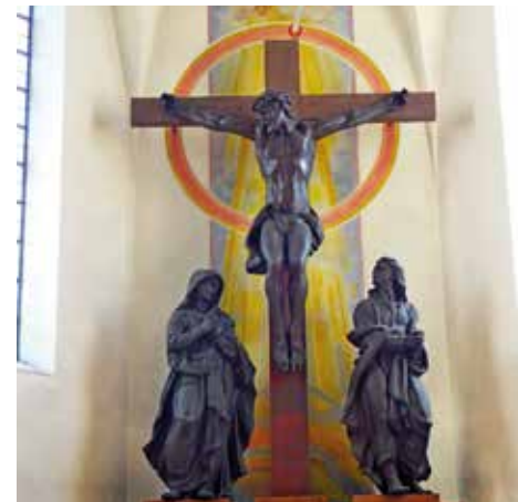
Die Kreuzigungsgruppe und das dahinter befindliche Altarbild bilden zusammen eine eindrucksvolle Einheit. Bild: Maydl

Karl Radinger wurde 1912 in Kriegshaber geboren. Nach Kunststudium und Wehrmacht wurde er 1946 Mitglied der Künstlervereinigung „Die Ecke“. In diese Zeit fallen auch die ersten religiösen Gemälde, so 1947 der Kreuzweg in St. Wolfgang in Meitingen.