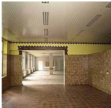
Die Räumlichkeiten von innen.*

Quelle: Unser Dank gilt dem Verein „Amerika in Augsburg e.V.“, der uns seine Informationen sowie Bilder zur Verfügung stellt. Weitere Informationen zum Verein und den Themen gibt es unter www.amerika-in-augsburg.de .