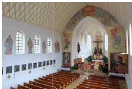
Innenraum von St. Wolfgang in Meitingen. Hier ist das gesamte Werk Radingers, das er in dieser Kirche geschaffen hat, zu sehen: Der Kreuzweg, die Apostelbilder, die Seiten- und Hauptaltarbilder und der sehr eindrucksvolle Chorbogen, eines der Hauptwerke des Künstlers