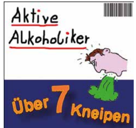
Das CD-Cover „Über sieben Kneipen...“

Das Internet macht's möglich. „Um auf eine Hörerzahl von zwei Millionen zu kommen, hätte man früher zehn Jahre lang mindestens 200 Diskotheken jährlich besuchen müssen, um dort sein Lied vorzustellen. Im Internet verbreitet sich der Song von selber“, weiß Braumeister. Da sie selbst nicht Urheber des Stückes sind, verdienen die Hobby Musiker damit kein Geld. Das wollen sie aber auch gar nicht. Ih-