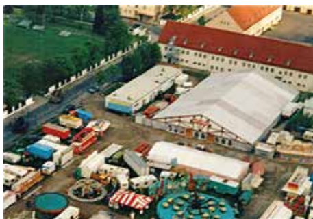
Hier eine Luftaufnahme um 1990. (Foto: via Bobbi Martinek)*

Trotz bescheidener Anfänge des Volksfestes, das anfangs von der American Youth Activities Gruppe mit Kinder- und Jugendbetreuung initiiert wurde, erfreute sich der Ami-Plärrier auf dem Platz der heutigen Herman-Schmid-Akademie in der Sommerstraße später großer Beliebtheit. Das lag womöglich in den frühen Jahren daran, dass das Volksfest für die Einheimischen ein ungewohnter Tummelplatz der Schlemmerei, des Fast Foods und der bayerischen Spezialitäten war. Erstmals gerieten die Augsburger in Kontakt mit Hamburgern, gegrillten Maiskolben, BBQ-Ribs und Tex-Mex-Tacos.