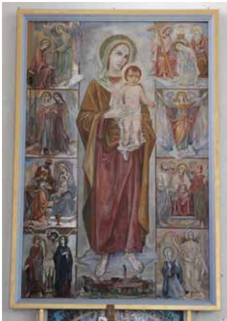
Der Linke Seitenaltar

Zu erreichen ist Zaisertshofen über die B 300 – Diedorf, Gessertshausen, dann Fischach, Langen-, Mittel- und Oberneufnach und Markt Wald. Die Kirche ist tagsüber geöffnet und barrierefrei! Ein Besuch lohnt sich!