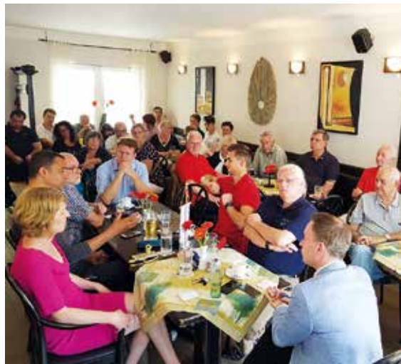
Rund 30 Besucher folgten der Einladung...