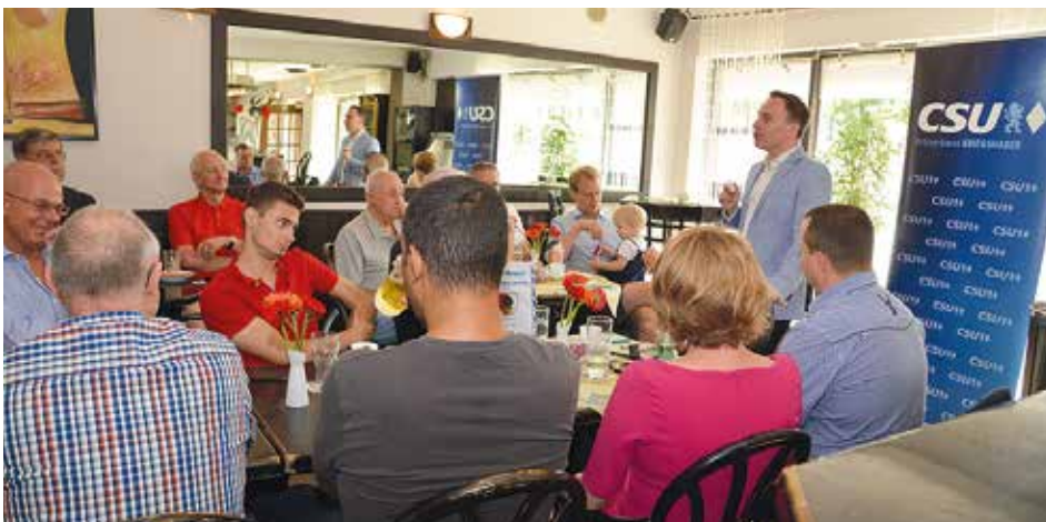
... und diskutierten mit dem Bundestagsabgeordneten über die derzeitige Situation in Berlin.

Am 15. März 2020 wird in Augsburg der neue Stadtrat gewählt. Vergangenen Monat hatte die CSU Augsburg ihre Stadtratsliste verabschiedet.