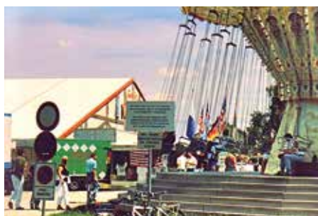
Ein kasernentypisches Ordnungsschild am Zugang zum Festplatz. Man bewegte sich auf „Military Area“.*

All diese Tatsachen waren wohl auch Gründe dafür, dass die Militärpolizei oftmals eingreifen musste, wenn es aufgrund übermäßigen Alkoholgenußes zu blutigen Entgleisungen und Massenschlägereien kam. Dem „Maßkrugklau“ wirkten die Festwirte durch die Einführung von Billigkrügen entgegen.