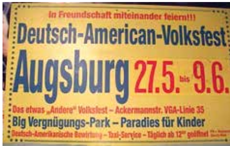
Mit Wortschöpfungen machten die Plakate das Deutsch-Amerikanische Volksfest publik.*

In den 1960er Jahren begann das Zeitalter der Deutsch-Amerikanischen Volksfeste, auch Freundschaftsfeste oder Ami-Märkte genannt. 1963 erreichte der Trend nach Aussagen auch Augsburg. Der Ami-Plärrier war geboren: knallig, bunt und schrill!