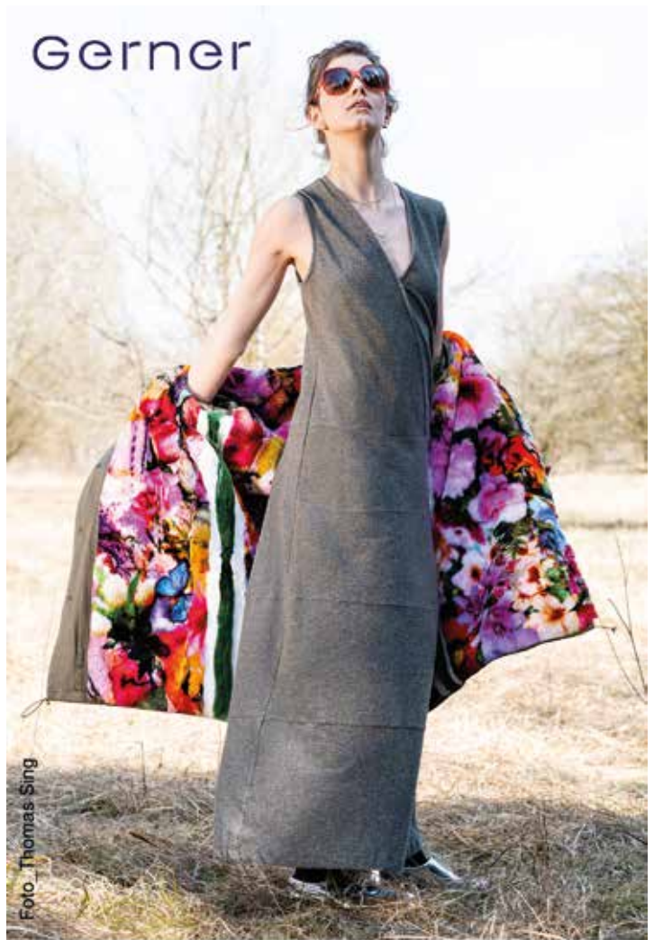
ulmer straße 152 - tel. 0821/40 77 73 - www.pelz-gerner.de

12:30 Uhr „Nicht nur ein Ma(h)l!“ – Herzliche Einladung zum gemeinsamen Mittagstisch Alle 14 Tage, immer mittwochs. wo: St. Thomas, Rockensteinstr. 21