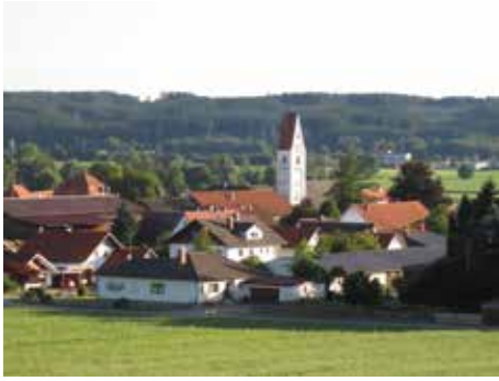
Blick auf Zaisertshofen

Zaisertshofen ist ein idyllisches Dorf im Unterallgäu. Es gehört zur Gemeinde Tusenhäusern. Man sieht ihm auf den ersten Blick nicht an, dass es zwei künstlerische