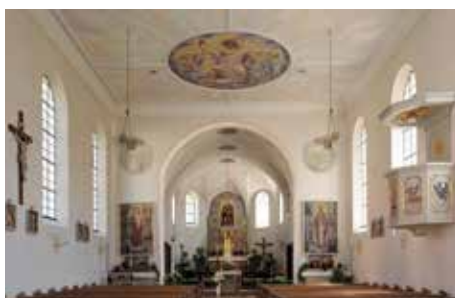
Blick zum Altar