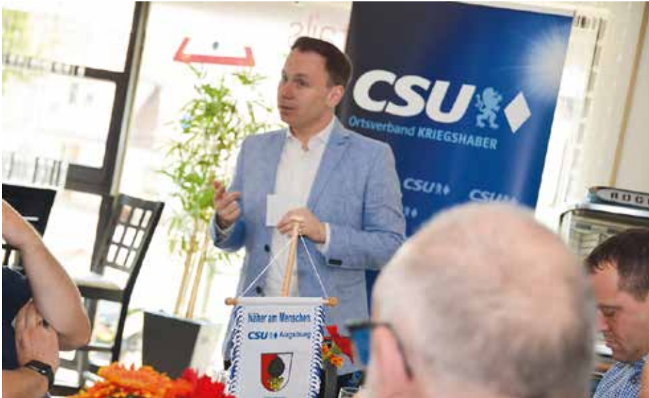
Bundestagsabgeordneter Dr. Volker Ullrich stellt sich den Fragen der Besucher

Über 30 Gäste folgten am 21. Juli der Einladung der CSU Kriegshaber zum Politischen Frühschoppen ins Café Link in der Ulmer Straße. Im Rahmen seiner Sommertour 2019 war der Augsburger Bundestagsabgeordnete Dr. Volker Ullrich als Gastredner gekommen. Ullrich referierte über die derzeitige Situation in Berlin, darunter auch die Besetzung des Verteidigungsministeriums. Anschließend stellte er sich den zahlreichen Fragen der Besucher. „Ich bin immer wieder gerne in Kriegshaber. Hier zeigen die Gäste großes Interesse an der politischen Diskussion und das macht Spaß“, so der Bundestagsabgeordnete.