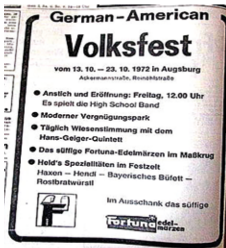
Ein Veranstaltungsinserat von 1972.*

Vor diesem wurden die Amerikaner jedoch gewarnt, da der Alkoholgehalt des deutschen