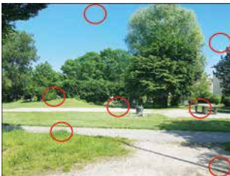
Die Lösung der letzten Ausgabe

Ein nicht ganz so dramatisches Thema ist