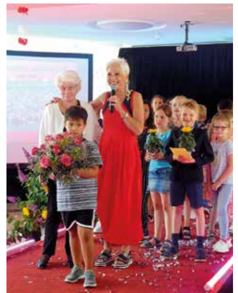
Unter den Gästen war auch ihre Mutter (li).