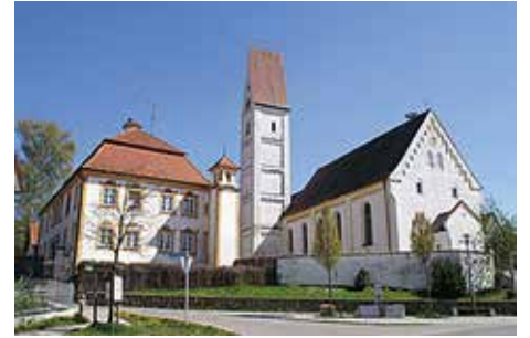
Kirche St. Silvester und Pfarrhof

Text: Bernhard Radinger/ Erich Maydl