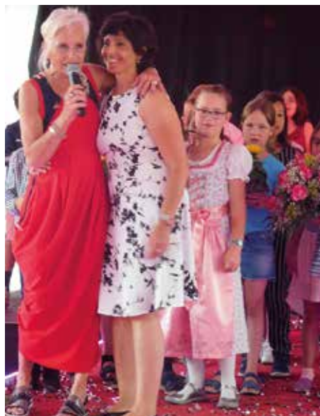
...feiert mit vielen Weggefährten.