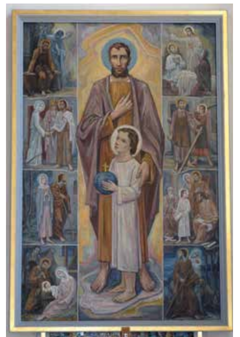
Der rechte Seitenaltar