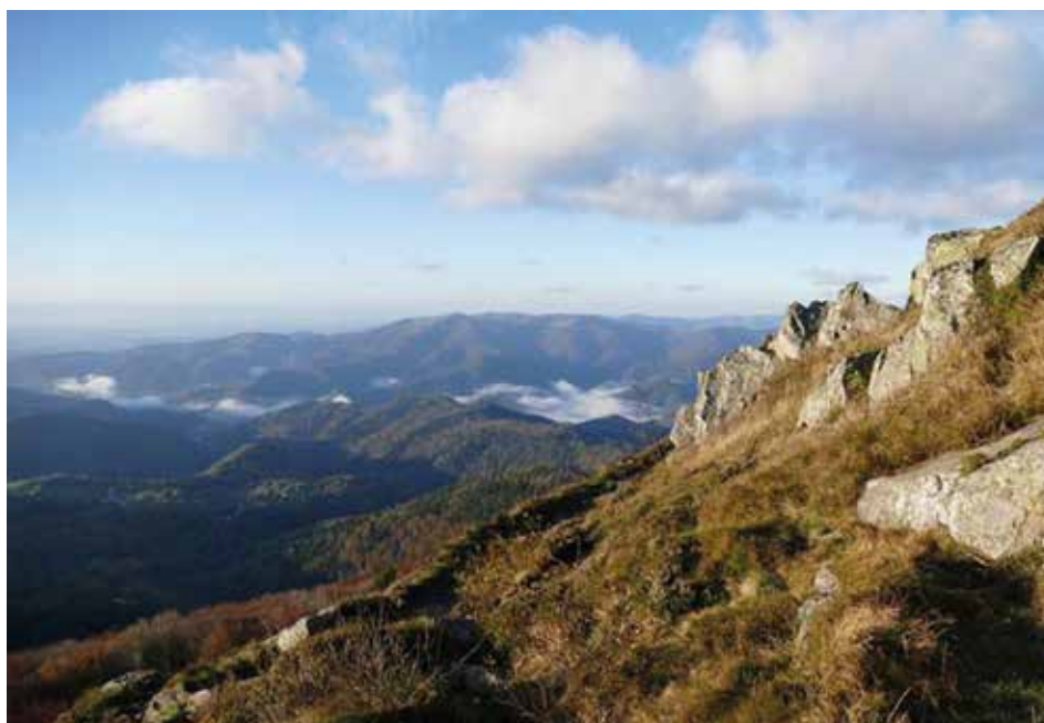
Blick über die Vogesen in Ostfrankreich.

Die Vogesenstraße im Süden Kriegshabers ist eine Seitenstraße der Markgrafenstraße. Sie verläuft entlang der B17 und endet an der „Hundemeile“, einem Fußweg entlang der Bgm.-Ackermann-Straße. Benannt wurde sie nach den Vogesen, einem Mittelgebirge in Ostfrankreich mit einer Erhebung von bis zu 1424 Metern.