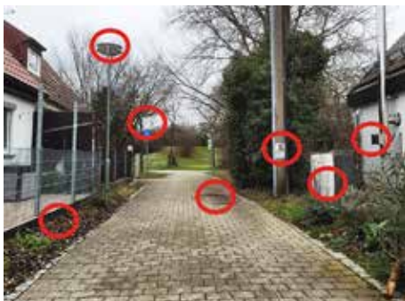
Die Lösung des Suchbilds der letzten Ausgabe

Ratzfatz war diese Ausgabe gefüllt: das Titelbild ein Schnappschuss von einem Spaziergang, eine Seite voller Bilder von den Faschingsveranstaltungen beim TSV Kriegshaber, der Kolpingsfamilie Kriegshaber und der Pfarrei Heiligste Dreifal-