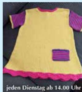
jeden Dienstag ab 14.00 Uhr

Weitere Infos gibt es online im Internet unter www.st-anna-augsburg.de/gemeinsames-singen-nach-einer-corona-infektion ■