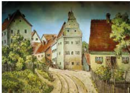
Bühnenbild einer Theater-Aufführung des Gesellenvereins. Der Bühnenmaler hat die Handlung in Kriegshaber angesiedelt; hier: Kriegshaberstraße/Bergstraße

In einer Zeit, in der noch niemand vom Fernsehen träumte, in der viele unter Not und Arbeitslosigkeit litten, waren die Menschen