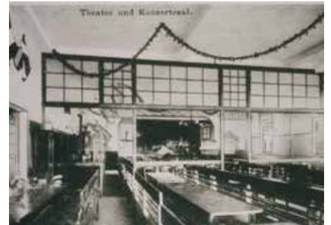
Der große Theatersaal im Saalbau „Drei Rosen“, Aufnahme ebenfalls um ca. 1930. In den 1950er Jahren war in diesem Saal ein Kino beheimatet: Das Lichtspielhaus „Luxor“

Der Chronist berichtet: „Die Aufführung wurde nach dem Akt mit stürmischem Applaus gefeiert.“ Noch im selben Monat war der Saal mit einem neuen Stück voll besetzt. Aufführungsort war stets der Saalbau „Drei Rosen“. 1927 wurde Bühnenbeleuchtung angeschafft. Die Zahl der Requisiten und Bühnenbilder wurde immer größer. Sie wurden auch an andere Vereine gegen Gebühr ausgeliehen. Der Andrang zu den Aufführungen war so groß, dass die Stühle nummeriert und Karten ausgegeben werden mussten. Die Einnahmen brachten eine willkommene Verbesserung der Vereinskasse. Zwei Männer engagierten sich in dieser Zeit mit großem