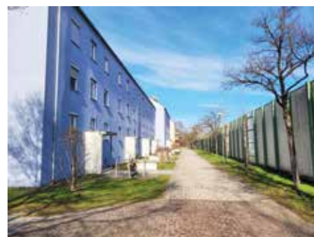
Die Vogesenstraße in Kriegshaber