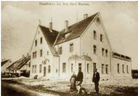
Gaststätte und Saalbau „Drei Rosen“ in der Rößlestraße

wurden unter anderem ein Stenografiekurs und Unterricht in Deutsch und Französisch angeboten. Nach dem Ersten Weltkrieg berichteten die Protokolle regelmäßig und eindrucksvoll über die Theateraufführungen des Gesellenvereins. Die Jubiläumsschrift zum 100-jährigen Bestehen schreibt über die Theateraufführungen der Zeit zwischen 1920 und 1934 wie folgt(*):