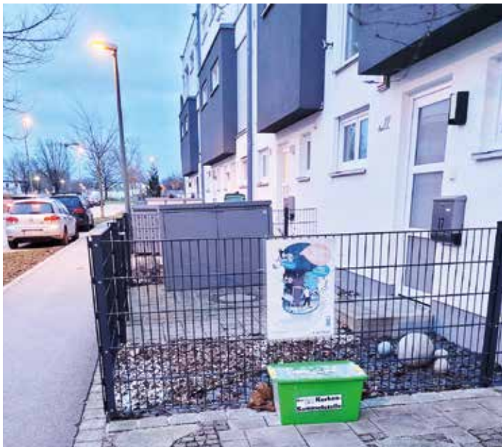
Die Korken-Sammelstelle an der Reeseallee 19

Er ist in nahezu allen Haushalten zu finden: Der Korken. Dabei ist er viel mehr als ein Flaschenverschluss. Er ist Produkt einer jahrhundertealten nachhaltigen Landbewirtschaftung in den Korkeichenwäldern. Kork hat eine gute Klimabilanz und lässt sich ohne Probleme recyceln. Jedes Jahr fallen in Deutschland rund 1,2 Milliarden Korken an. Der Hamburger Naturschutzbund hat sich mit dem Projekt KOR-Kampagne etwas einfallen lassen: Haushalte sollen ihre Korken an Sammelstellen abgegeben, damit sie weiterverarbeitet werden können.