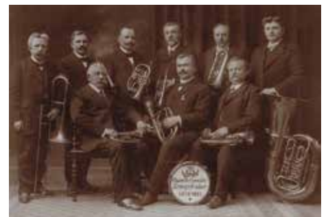
Sie sorgten für tolle Stimmung im Saal: Musikkapelle „Cäcilia“ (um 1913)

Herausgeber: Kolpingfamilie Kriegshaber. Der Beitrag über die Theatertradition stammt von Siegfried Off