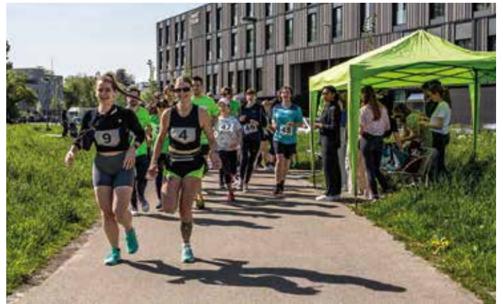
Beim Lauf einsmehr kamen über 30.000 Euro an Spenden zusammen.

Die Verantwortlichen von einsmehr – Initiative Down-Syndrom Augsburg und Umgebung strahlten mit der Sonne um die Wette: Beim Lauf einsmehr am 7. Mai nahmen über 300 Läuferinnen und Läufer teil, so viele wie nie zuvor. Sie hatten sich im Vorfeld Sponsoren gesucht, die pro gelaufener Runde einen selbst festgelegten Betrag spenden.