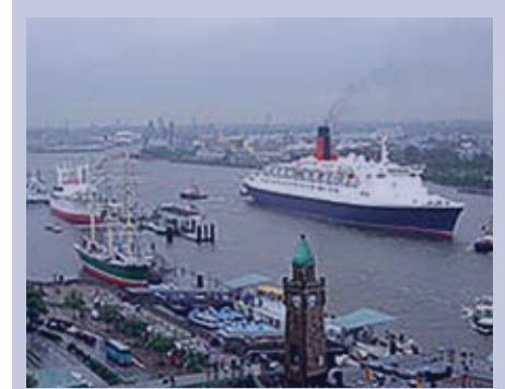
Die „Queen Elizabeth 2“ lief 1967 vom Stapel und fuhr bis 2004 im Transatlantik-Liniendienst (Southampton – NY und zurück). Danach war sie bis Ende 2008 als Kreuzfahrtschiff auf großer Fahrt. Nach über 500 Atlantik-Überquerungen wurde sie 2009 außer Dienst gestellt und liegt seitdem als Hotelschiff vor Dubai vor Anker.

Quellen: Erinnerungen Rainer Neher und Bernhard Radinger, Wikipedia