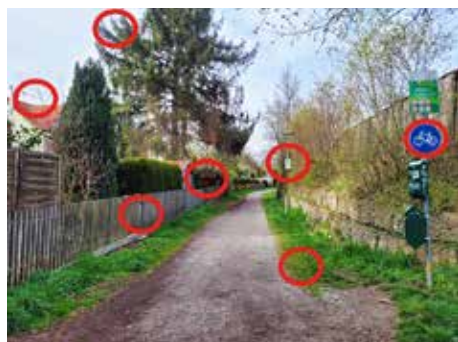
Die Lösung des Suchbilds der letzten Ausgabe

Ob am Verkehr auf den Autobahnen, den Fotos in der Familiengruppe des Lieb- lings-Messengers oder bei der Produk-