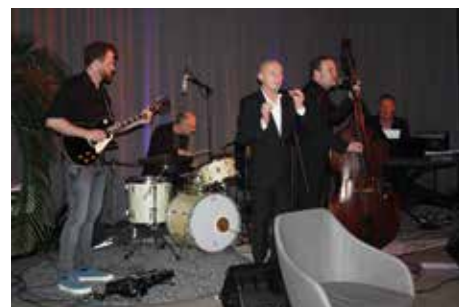
Die Band „Blues & Beyond“ begeisterte beim Konzertauftritt am 14. Mai zahlreiche Zuhörer

Der gemeinnützige Verein Westhouse Community e.V. möchte für interessierte Menschen in Kriegshaber künftig weitere Konzerte und Kulturveranstaltungen verschiedenster Art anbieten. Erst kürzlich hat er dazu die Konzertreihe „Westhouse Music“ in Kriegshaber gestartet. Zum Auftakt war im Foyer des Westhouses die Gruppe „Blues