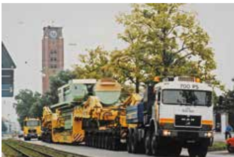
Auf Spezialfahrzeugen rollen die Großdieselmotoren durch die Ulmer Straße

Antrieb: 9 x MAN B&W-Viertakt-Dieselmotoren mit je 9 Zylindern Leistung: 95,625 KW (130.050 PS) Höchstgeschwindigkeit 32,5 kn (ca. 60 km/h) Größe: Länge ü. A. 293,5 m Breite 32,03 m Höhe (Unterkante Kiel bis Oberkante Schornstein): 52,2 m Tiefgang: Max. 9,87 m