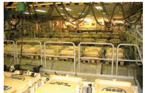
Ein Teil des Maschinenraums der Queen Elizabeth 2 mit Generatoren zur Stromerzeugung