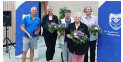
Es gab Blumen und Wein für scheidende Ausschussmitglieder