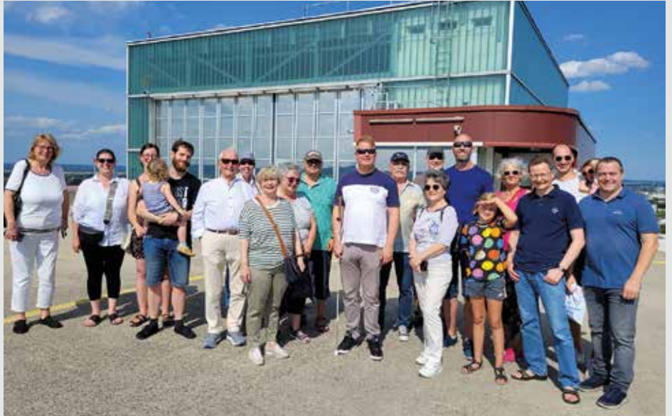
Die Besuchergruppe bei der Luftrettungsstation „Christoph 40“ auf dem Dach der Uniklinik

Höhepunkt der Besichtigung war die Landung des Rettungshubschraubers „Christoph 40“, der gerade von einem Einsatz zurückkam. Dabei musste sich die Besuchergruppe in den geschützten Eingangsbereich der Station zurückziehen und durfte die Landephase von dort aus miterleben. Der Pilot stellte sich anschließend den Fragen der Gäste und diese durften das Cockpit des Hubschraubers besichtigen. Die Luftrettungsstation ist seit 2014 im Einsatz und hat bereits mehr als 12.000 lebensrettende Einsätze geflogen. ■