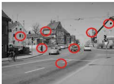
Die Lösung des Suchbilds der letzten Ausgabe

Haben Sie den Sommerfest-Marathon im Juli gut überstanden? Ich auf jeden Fall. Ein Highlight war das Zusammenkommen