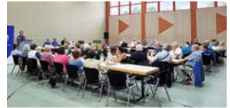
Die Mitgliederversammlung fand in der Vereinshalle am Kobelweg statt