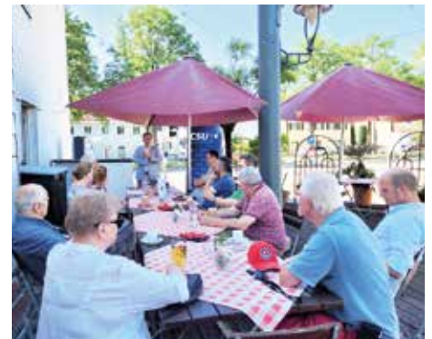
Der Politische Frühschoppen fand auf der Sonnenterrasse des Café Link statt