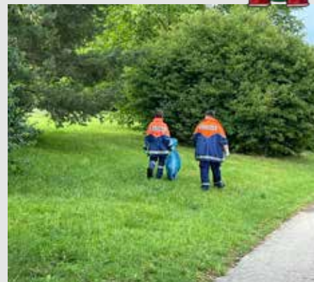
Drei volle 120-Liter-Säcke an Müll haben die Jugendlichen in den Parks gesammelt

Neben dem Feuerwehr-technischen Aspekt muss auch eine öffentlichkeitswirksame Arbeit vollbracht werden. Die Jugendlichen haben in diesem Fall die Parks rund um die Feuerwehrwache vom Müll befreit. In knapp einer Stunde sind dabei drei volle 120-Liter-Säcke an Abfall zusammengekommen. ■