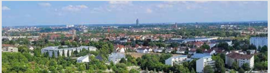
Von der Luftrettungsstation bietet sich ein sensationeller Ausblick über Kriegshaber