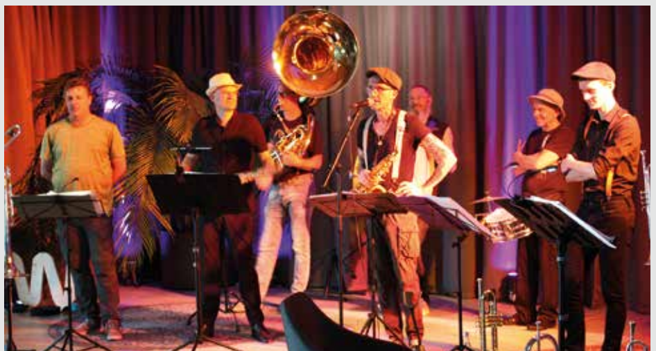
Die „Brazzeria Brass Band“ spielte am 9. Juli im Westhouse Augsburg

Über Standards aus New Orleans, interessant arrangierte Hits der Pop Musik bis hin zu sehr gelungenen Eigenkompositionen, konnten sich die Zuhörer erfreuen. Nicht minder freudvoll und witzig aber eben