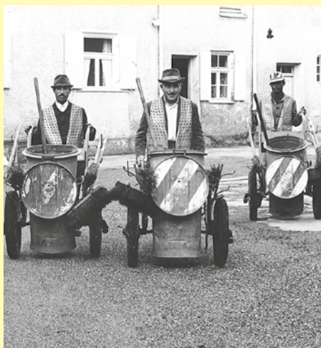
Die „Donnamänner“ und „Schdrossakehrer“ bei ihrem Einsatzort in Kriegshaber. Die Reinigung erfolgte weitgehend in Handarbeit

Da ich gerade an der Fotoschule München die Aufgabenstellung „Auf dem Weg zur Arbeit“ bekommen hatte, konnte ich diese Bilder gleich hierfür verwenden. ■