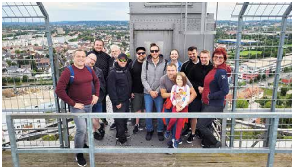
Auf der Aussichtsplattform des Gaskessels in 80 Metern Höhe, Kriegshaber im Hintergrund.