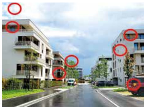
Die Lösung des Suchbilds der letzten Ausgabe

Die Idee für dieses Vorwort kam mir ver- hältnismäßig früh – und zwar beim Aus- tragen der vergangenen Ausgaben. In der