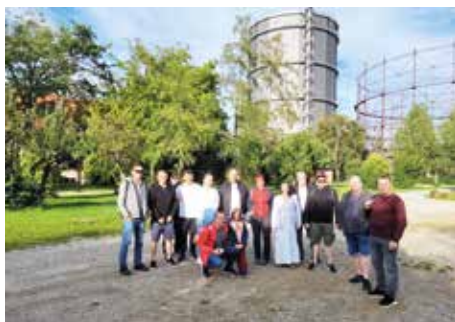
Die Besuchergruppe auf dem Gelände des Gaswerks vor dem Gaskessel