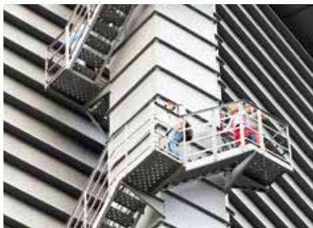
392 Stufen müssen Besucher erklimmen, um auf die Aussichtsplattform zu gelangen.