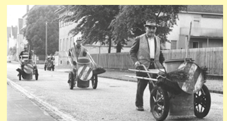
Die „Donnamänner“ auf ihrem Weg vom Depot an die Weldishofer Straße in Kriegshaber; Foto von 1970