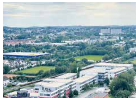
Der Sportplatz ESV Augsburg, im Hintergrund die Uniklinik Augsburg.