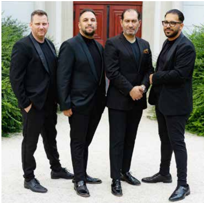
„Swing à la Django“

„Swing à la Django“ ist eine einzigartige und virtuose Band, die Gipsy Jazz spielt – sie selbst nennen es Django Pop. Sie haben eine einzigartige Mischung von Stilen geschaffen, indem sie Popmusik mit authentischer Balkan-Folk-musik, französischem Manouche-Swing und argentinischem Bossa Nova in Einklang brachten – das Ergebnis ist ein einzigartiger Stil, eben Django Pop.