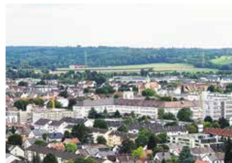
Ein Blick vom Gaskessel nach Kriegshaber. In der Bildmitte: Die Heiligste Dreifaltigkeit.