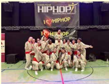
Bei der Hip Hop-Meisterschaft

Die Tanzschule Chill & Dance aus Kriegshaber hat neben den zahlreichen Kindertanz, Hip Hop und Sportkursen auch Meisterschaftsgruppen, die jedes Jahr sehr erfolgreichen auf Hip Hop-Meisterschaft in ganz Deutschland unterwegs sind. In der kommenden Saison treten sie sogar mit 7 Teams, bestehend aus den Altersklassen Mini Kids, Kids, Juniors 1, Juniors 2, Adults, Adults Profileague und ganz neu, dem Ü30 Team, an. Es wird jetzt schon ganz fleißig trainiert um auch nächstes Jahr wieder so oft wie möglich auf dem Treppchen zu stehen.