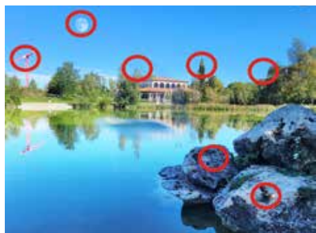
Die Lösung des Suchbilds der letzten Ausgabe

Irgendwie ist in unserem Stadtteil alles noch so herbstlich: Im Reese Park lassen die einen Kinder Drachen steigen, die anderen sammeln nicht unweit davon entfernt Kastanien.