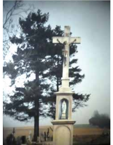
Das Feldkreuz, unter diesem Feldkreuz liegt mein Vater begraben

Ich traf einen Bauern, der so alt war wie ich und dieser erzählte mir auf Deutsch: Es haben schwere Kampfhandlungen in seinem Dorf mit der russischen Armee stattgefunden,