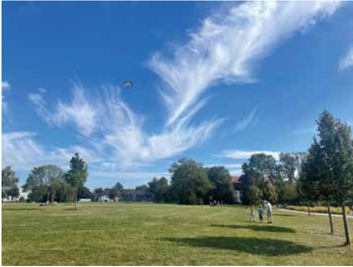
Der Papa erklärt seinen Jungs, wie sie den Drachen halten müssen.