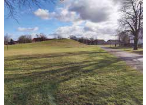
Nach dem Neujahrsputz war der Park wieder sauber und ansehnlich

ten des Gehirnakrobaten, der im Park mit Plastikconfetti gewütet hat, mussten dann aufgrund der schieren Anzahl den Händen des Windes überlassen werden. Den Kindern hat es Spaß gemacht, aber trotzdem ihr Appell: Bitte nehmt eure Sachen wieder mit und werft sie in die Mülleimer. Dann haben wir nicht noch Tage später was davon. ■