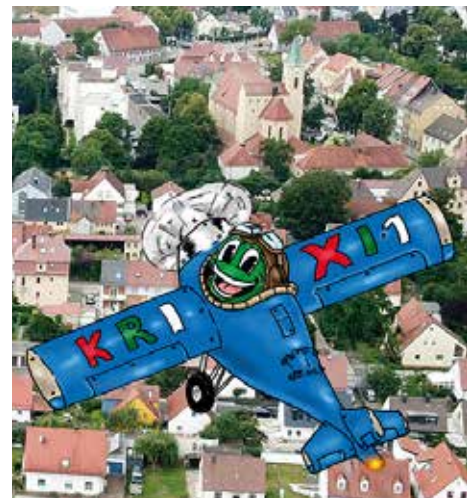
„Krixi im Flugzeug“ zierte im Juli 2020 das Titelbild des KriegshaberBlatts. Es zeigte eine Luftaufnahme von Kriegshaber.