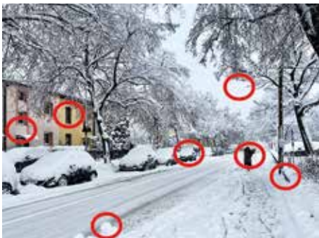
Die Lösung des Suchbilds der letzten Ausgabe

Der Februar wird bunt, schließlich ist er der Monat des Faschings. Heuer sind die Narren etwas früher dran – für Stimmung