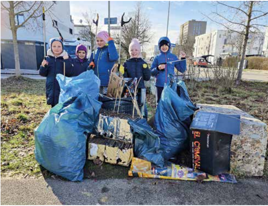
In zwei Stunden wurde dieser große Müllberg im Reese Park aufgesammelt

Silvester – Zeit des guten Essens, Zeit der Partys, Zeit der guten Vorsätze und Zeit des wilden Böllerns. Dass das sowohl körperlich als auch an unserer Umwelt nicht spurlos vorübergeht, weiß jeder, der am Neujahrstag durch den Reese Park streift, um die Reste der gestrigen Völlerei loszuwerden. Wo man hinsieht, liegen die Zeugen des bunten Feuerwerks: verschossene Böller, Reste von Raketen, unzählige Papierfetzen, Flaschen und Dosen, quer verteilt über Wege und Rasen. Da auch die Kinder aus dem Karl-Radinger-