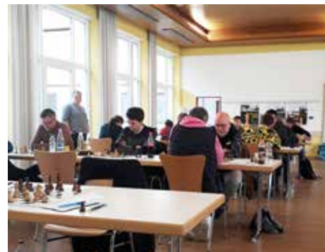
Der Wettkampf fand im Pfarrsaal Heiligste Dreifaltigkeit statt