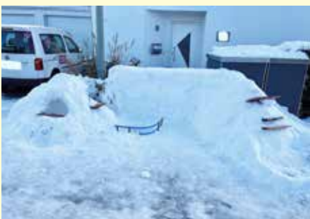
Die mysteriöse Mauer steht normalerweise nicht dort.

Mysteriöse Mauer im Süden Kriegshabers war eine Schneebar