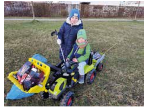
Sogar mit speziellem Gerät rückten die Kinder für den Neujahrsputz an

Nur knappe zwei Stunden später konnte die Gruppe dann auf ein doch beachtliches Ergebnis blicken. Einzige die Hinterlassenschaf-