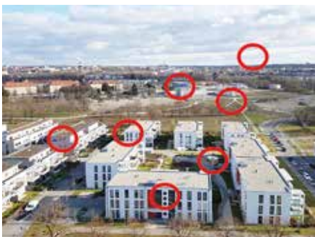
Die Lösung des Suchbilds der letzten Ausgabe

Kaum ist der Fasching vorüber, steht schon das nächste Fest in den Startlöchern. Ostern ist heuer früh dran. Doch