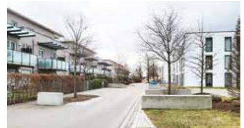
Der Annegret-Fuchshuber-Weg in Kriegshaber