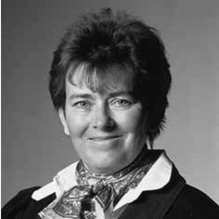
Annegret Fuchshuber

Der Annegret-Fuchshuber-Weg ist eine Seitenstraße der Reeseallee und befindet sich im Süden des Reese Parks. Benannt wurde die Straße im Jahr 2012 nach der deutschen Illustratorin Annegret Fuchshuber, die am 6.