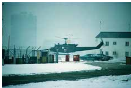
Flak Kaserne 1981: Eine Bell UH1-H erhebt sich im Morgengrauen zum Rettungseinsatz. Im Hintergrund der Oberhausener Gaskessel.*

Gablinger Flugplatz niederließ, wurden aufgrund ihres Fluggeräusches auch Teppichklopper genannt. Einer der Hubschrauber stand beim US-Krankenhaus in der Flak Kaserne stets einsatzbereit. Die Maschinen kamen aus dem Vietnam und waren in einem entsprechenden Zustand. Deshalb wurden sie ein Jahr später durch