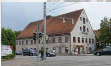
Äußerlich ist vom Glanz vergangener Tage nicht mehr viel zu sehen. Der Marstaller Hof heute.

Bericht: Erich Maydl Quellen: Heinz Wember; Wikipedia