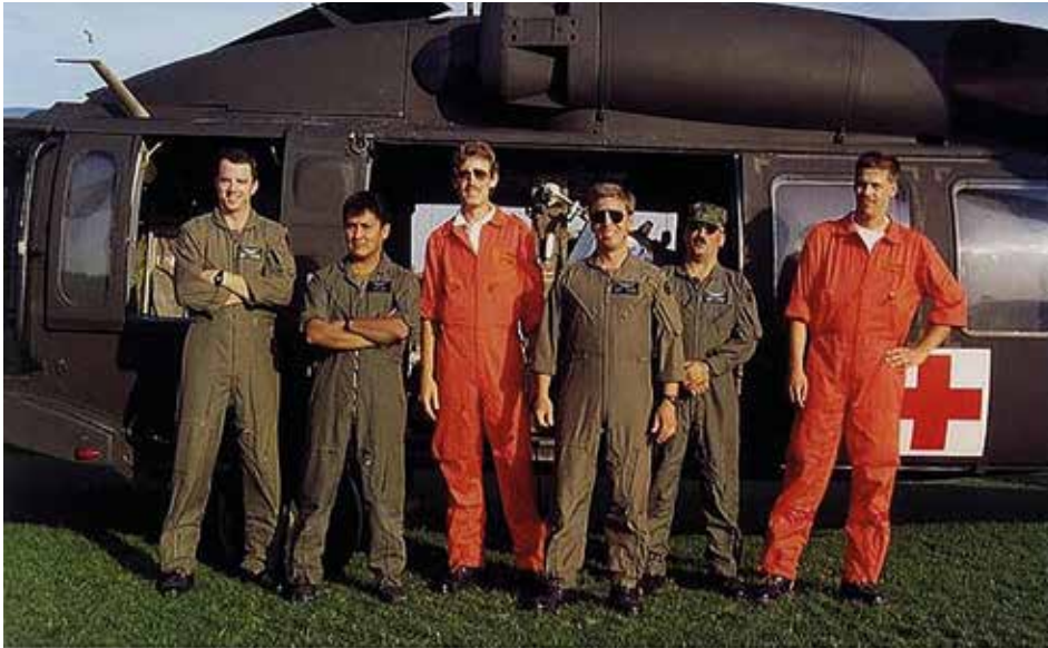
Einsatzbereit von 00-24 Uhr: die „Dustoffs“. (Andreas Liebau)*

Bereits damals landete regelmäßig ein Hubschrauber in Kriegshaber und lieferte Patienten ab.