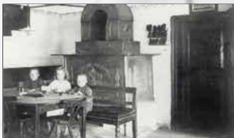
Innenraum des Marstaller Hof's 1910. Der historische Ofen ist ebenfalls noch erhalten.

Wegen seiner Lage an einer wichtigen Kreuzung haben sicher viele prominente Gäste hier übernachtet. Einer der Bekanntesten soll Napoleon gewesen sein, der 1805 vor seinem Einzug in Augsburg hier logiert haben soll (allerdings ist dies nicht historisch belegt).