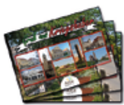
Postkarte "Gruß aus Kriegshaber" DIN A6 (14,8 cm x 10,5 cm)