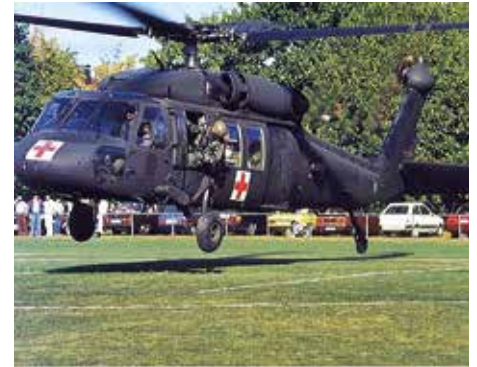
Flugvorführungen auf dem Gelände der Reese Kaserne. (Andreas Liebau)*

★ Nächstes Mal erwartet Sie: ★ James W. Reese