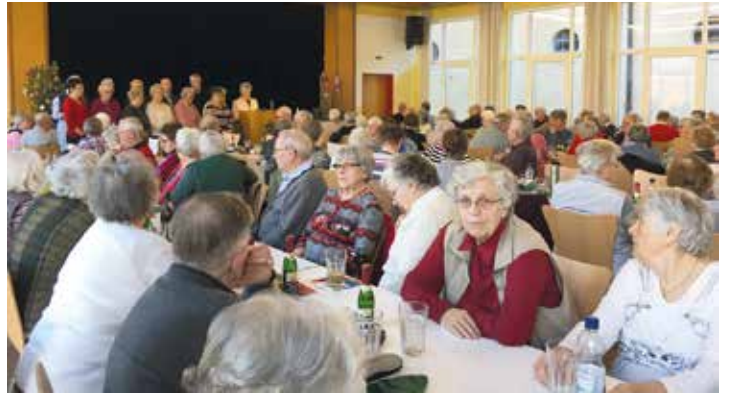
Monatlicher Treffpunkt bei vollem Saal

Waren es bei seiner Gründung nur 20 bis 40 Mitglieder, die den Seniorenkreis monatlich besuchten, sind es heute bis zu 150 begeisterte Teilnehmer. Ursprünglich diente der Gemeindesaal der Auferstehungskirche in Hochzoll als Veranstaltungsort. Aufgrund von Bauarbeiten suchte der Seniorenkreis jedoch eine neue Bleibe und hatte sich schließlich in Kriegshaber niedergelassen. Er trifft sich seit fünf Jahren im Pfarrheim Hlgst. Dreifaltigkeit an der Ulmer Straße.