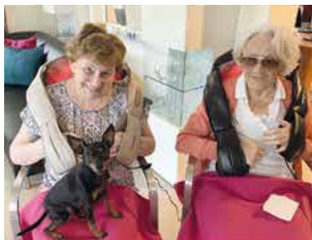
Die Gäste von der Tagespflege

Letzteres, die Wohngemeinschaft für etwas betagtere Bürger, entstand im September 2006 und befindet sich in der Färberstraße im benachbarten Augsburg Stadtteil Pfersee. Hier leben zwölf Personen unterschiedlicher Pflegegrade zusammen. „Zwar hat dort jeder sein Einzelzimmer um sich zurückzuziehen, man kann aber auch die Gemeinschaft suchen“, so Marion Demel.