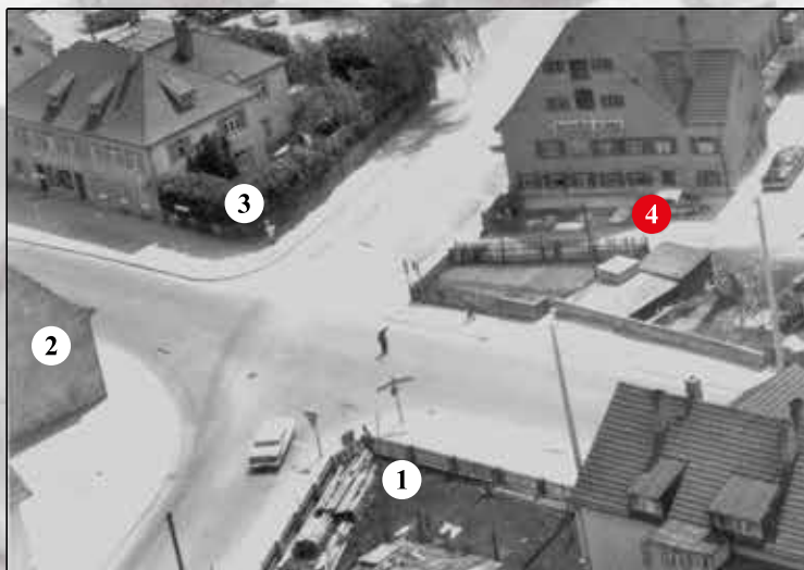
Luftaufnahme von 1957: Kreuzung Ulmer Straße/Ulmer Landstraße – Kriegshaber Straße/Neusässer Straße