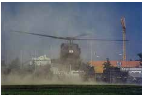
Der Schwarze Falken bei einem Einsatz am Kobelweg. (Andreas Liebau)*

★ Nächstes Mal erwartet Sie: ★ James W. Reese