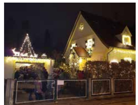
Gefeiert wurde in der dekorierten Garage und im Hof bei leuchtender Kulisse

Die Gäste ließen es sich gut gehen und waren zufrieden. Überhaupt versteht man sich äußerst gut in der Nachbarschaft im Heimstättenweg und der Landvogtstraße. Und so sind sich alle einig: Das Neujahrstreffen der Nachbarschaft kommt auch im nächsten Jahr wieder. ■