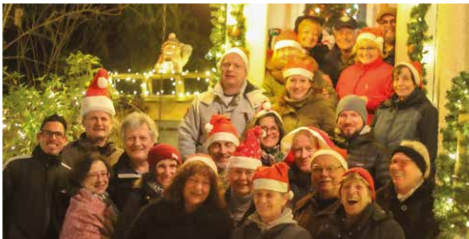
Die Nachbarschaft feiert zusammen.

Familie Fischer möchte, dass sich ihre Gäste bei ihnen wohlfühlen. Dies zeigte sich auch beim diesjährigen Neujahrstreffen der Nachbarschaft „Heimstättenweg und Landvogtstraße“ am 4. Januar. Bereits zum vierten Mal fand es statt - jedes Jahr ist es beliebter.