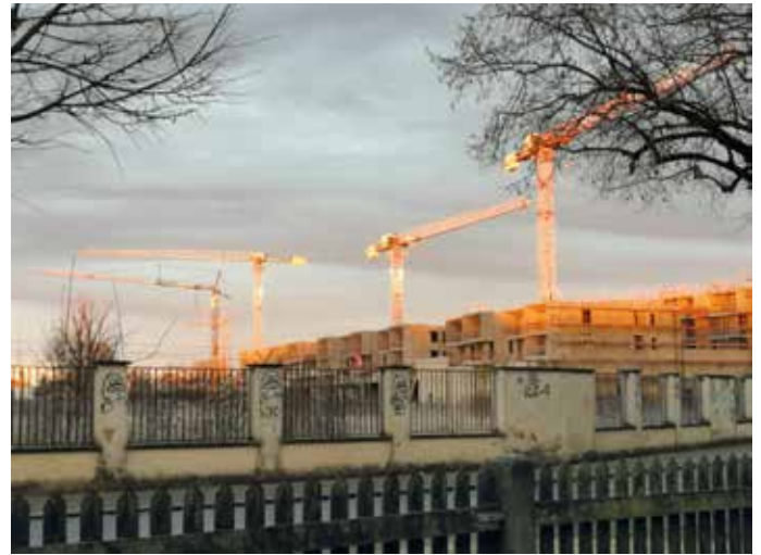
Blick auf die Baustelle im Reese Park