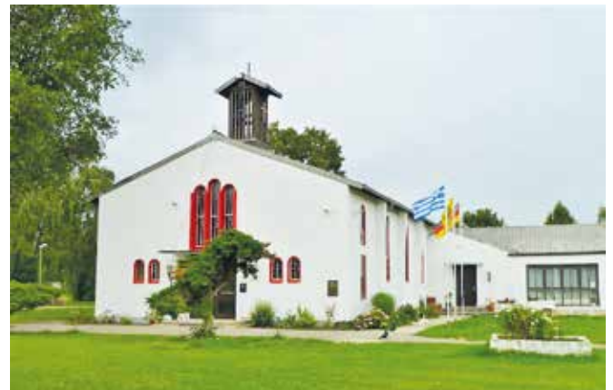
Kirche des Heiligen Panteleimon in Kriegshaber; Foto: mapio.net

Pfarrer der Kirche ist Erzpriester Christos Noulas. ■