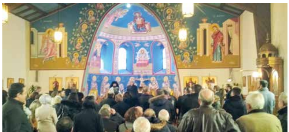
Volles Haus beim Neujahrsempfang