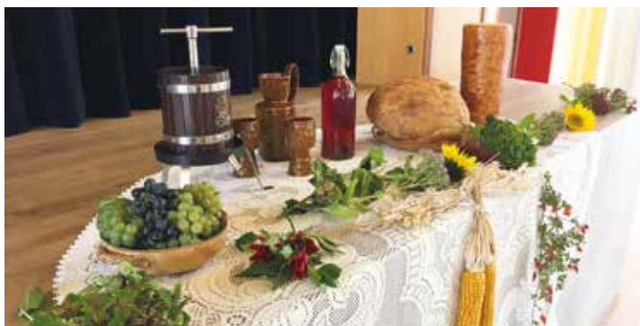
Die Dekoration wird immer angepasst an das Monatsmotto

Dieser trifft sich jeden 2. Dienstag im Monat (ausgenommen im August) von 14 bis 17 Uhr im Pfarrheim Hlgst. Dreifaltigkeit, Ulmer Str. 195a.