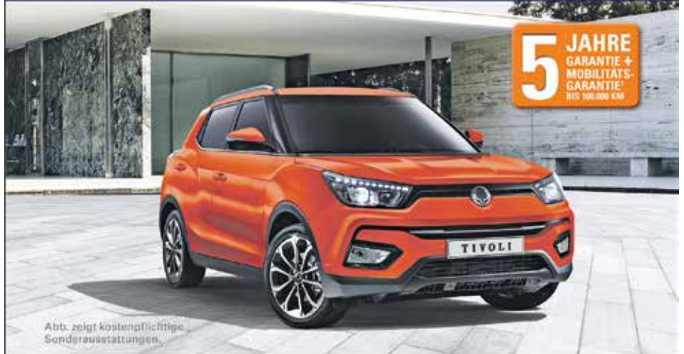
Abb. zeigt kostenpflichtige Sonderausstattungen.

Ein SUV mit vielen Talenten – auf und abseits der Straße.