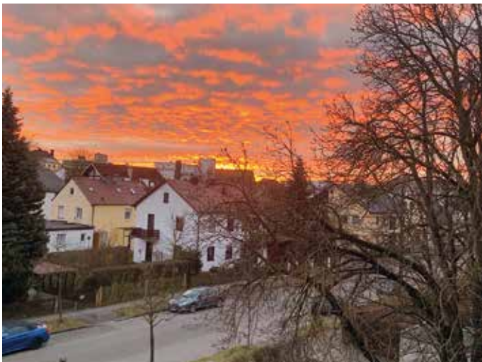
Sonnenuntergang über Kriegshaber

Haben auch Sie Fotos aus Kriegshaber, die Sie gerne mit uns teilen möchten? Dann schicken Sie diese an redaktion@kriegshaberblatt.de