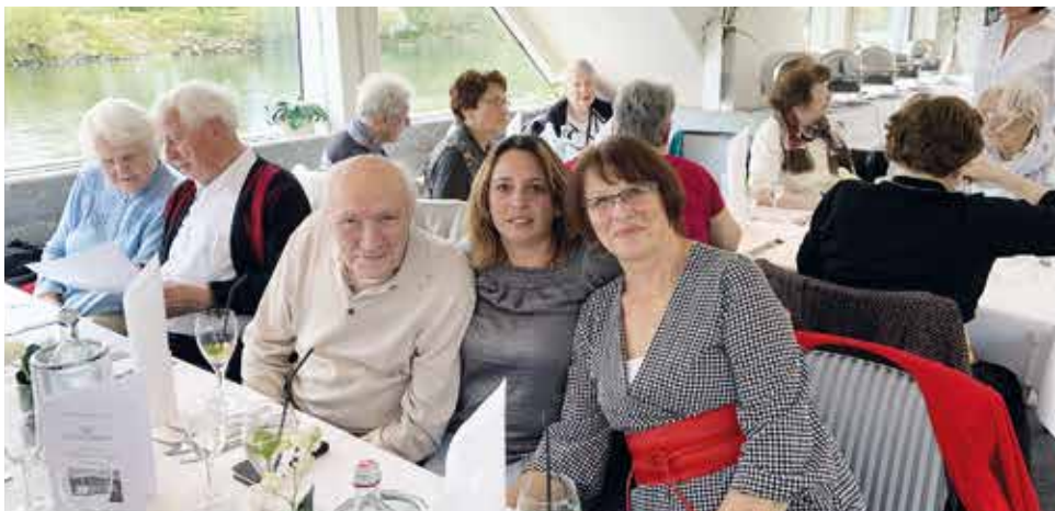
Gemeinsame Donaufahrt zum 20-jährigen Firmenjubiläum

Auch Ausflüge werden stets angeboten. Im vergangenen Herbst gingen die Patienten gemeinsam mit den Pflegekräften in Regensburg an Bord der „Kristallprinzessin“, einem Schiff für Donaufahrten. Dort feierten sie gemeinsam das 20-jährige Jubiläum der Unternehmensgründung. ■