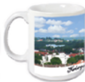
Kaffeetasse "Kriegshaber - Meine Heimat" mit Panorama-Fotodruck Keramikklasse 340 ml, Gewicht 380 g