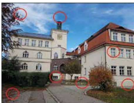
Die Lösung der letzten Ausgabe

Worüber wir in dieser Ausgabe zum Beispiel berichten? Na, das Fire & Ice der Freiwilligen Feuerwehr Kriegshaber, das im Januar stattfand. Natürlich durfte das