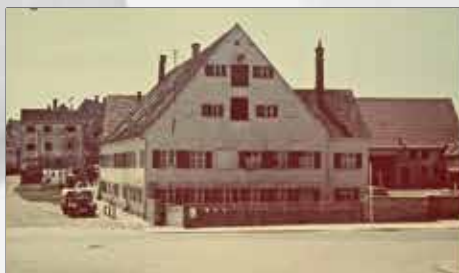
Der Marstaller Hof, 1939

Schon seit 1413 ist an der Stelle des heutigen Gebäudes eine Wirtschaft. Da hier früher eine Posthalterei bestand, gab es auch einen „ Marstaller “, also einen Stallmeister, der sich um die zahlreichen Pferde der Posthalterei kümmerte. Daher lässt sich auch der heute noch bestehende Name Marstaller Hof ableiten.