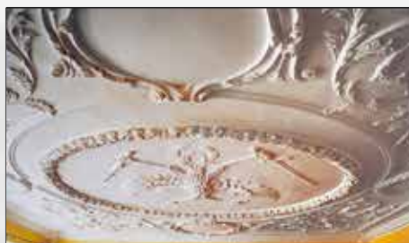
Der habsburgische Doppeladler im Deckenfresko erinnert noch an die Zeit, als Kriegshaber „österreichisch“ war

Das heutige Gebäude geht auf das 17. beziehungsweise 18. Jahrhundert zurück. Nach einer umfassenden Renovierung 1982 zog hier ein „Wienerwald“-Restaurant ein. Ab 2009 hatte hier, nach längerem Leerstand, das „Rock-Café“ eine Heimat gefunden. Derzeit ist wegen Bauarbeiten das ganze Gelände gesperrt und nicht betretbar.