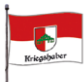
Flagge "Kriegshaber" 115 g Fahnenstoff, schwer entflammbar, Größe 135 cm x 90 cm