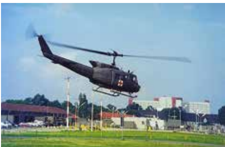
Bell UH-1H auf dem Gelände der Flak Kaserne. Im Hintergrund das Klinikum.

1973 sorgte die Stationierung des 236th Medical Detachment in Augsburg für Neuigkeiten. Mit insgesamt sechs Rettungshubschraubern war die „Bavarian Dustoff Air Ambulance“ rund um die Uhr für militärische Sanitätseinsätze in ganz Südbayern, aber auch in Norditalien und Österreich zuständig.