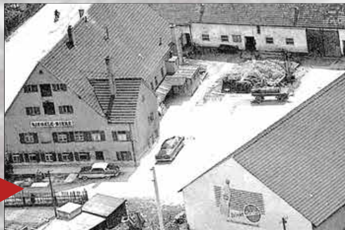
Marstaller Hof um 1957