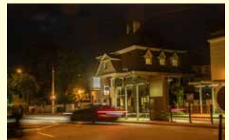
Das Straßenbahndepot und das Zollhaus an der Ulmer Straße