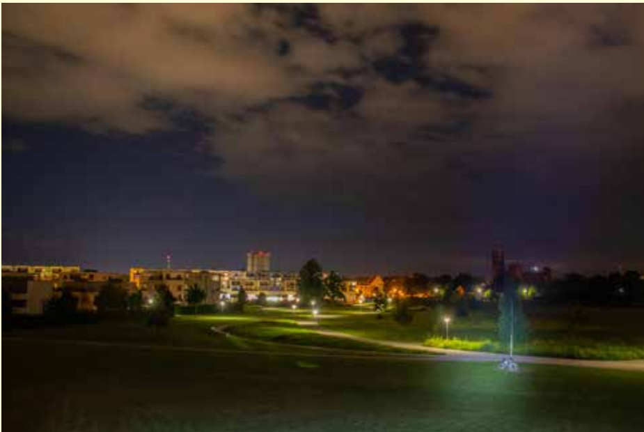
Blick in die Nacht vom Rodelhügel im Reesepark