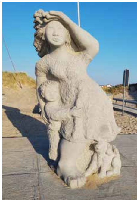
Das Fischerdenkmal in Agger, Dänemark.

Statue in Dänemark erinnert stark an eine Skulptur in Kriegshaber