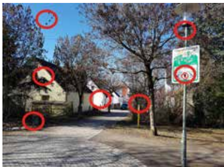
Die Lösung des Suchbilds der letzten Ausgabe