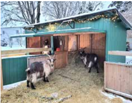
Die Lebende Krippe im Park von St. Thomas

Ein echter Publikumsmagnet: Seit 2016 steht im Park von St. Thomas jedes Jahr über die gesamte Adventszeit eine Lebende Krippe mit den beiden echten Gebirgsziegen Gogo & Robert.