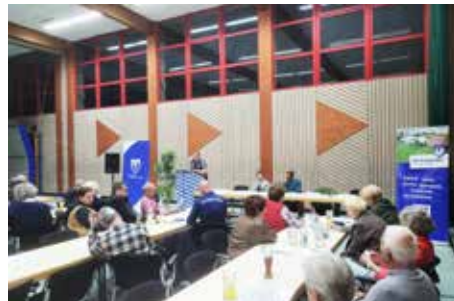
Blick in die Vereinsturnhalle

Die Mitgliederzahl sei bei rund 700 Mitgliedern weiterhin stabil. „Dies ist insbesondere das Ergebnis einer guten Jugendarbeit“, stellt Schnell fest. Der Verein plane derzeit Investitionen in die Sportanlage am Kobelweg, die heuer 42 Jahre alt wird. Neben der