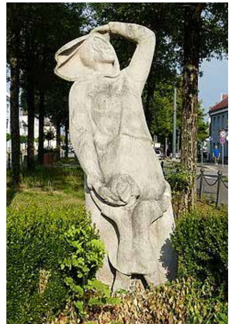
Die Skulptur „Mutter mit Kind“ steht seit 2006 auf der Verkehrsinsel an der Ulmer Straße