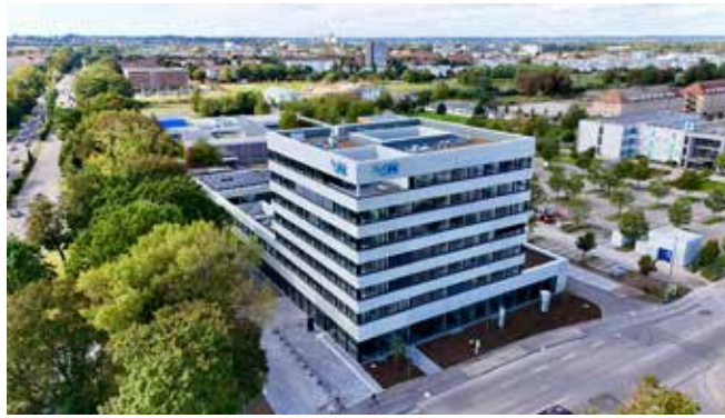
Die neue Firmenzentrale der Wohnbaugruppe Augsburg von der Stadtmitte aus gesehen, mit Blick in Richtung Westen.