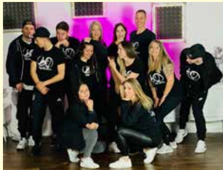
Das Team von Chill & Dance

Für die kleinen Tänzer bietet Chill & Dance altersgerechte Kurse, angefangen bei den Minikids (3-5 Jahre), die zu fröhlicher Musik tanzen oder beim Ballett erste Schritte wagen. Ab 6 Jahren können die Kinder bei den Dance Kids ihre motorischen Fähigkeiten weiterentwickeln und auch Akrobatik oder Breakdance ausprobieren.