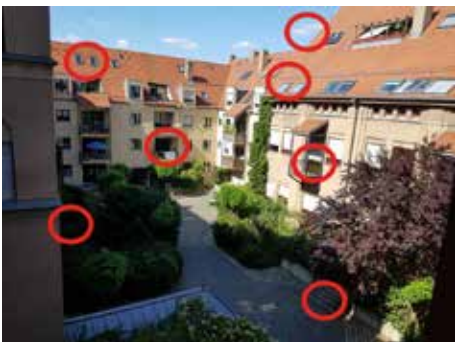
Die Lösung des Suchbilds der letzten Ausgabe

Während die Tage kürzer und kühler werden, verbreitet sich auch in unserem Stadtteil die Vorfreude auf die Adventszeit. Es ist eine Zeit des Übergangs – noch nicht ganz Winter, aber die ersten Lichter und Vorbereitungen lassen bereits erahnen, was uns erwartet.