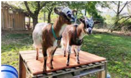
Die Zwergziegen Hanni & Nanni

Am 30. November ziehen die Afrikanische Zwergziegen Hanni & Nanni in den Stall