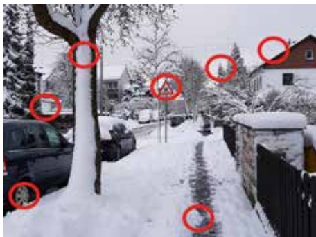
Die Lösung des Suchbilds der letzten Ausgabe

Ich bin mir sicher, dass 2025 wieder viele spannende Ereignisse und Projekte in unserem Stadtteil verspricht. Für uns, das Team des KriegshaberBlatts, steht fest: Wir freuen uns darauf, ein weiteres Jahr Teil des bunten