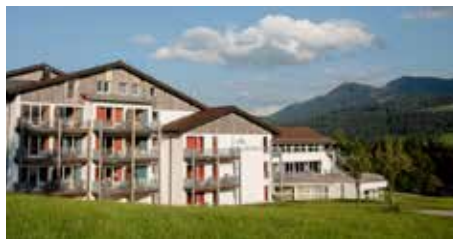
Das Allgäuhaus in Wertach

Freizeit und Bildungswochenende mit der Kolpingsfamilie Kriegshaber 14. - 16.02.2025 im Allgäuhaus in Wertach