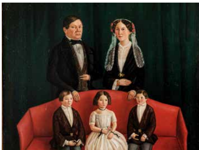
Porträt Familie Lippschütz um 1855, JM 19/2009