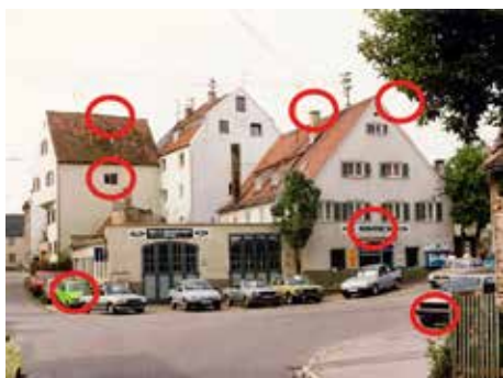
Die Lösung des Suchbilds der letzten Ausgabe

der März ist da, und mit ihm die ersten Anzeichen des Frühlings! Die Tage werden länger, die Sonnenstrahlen wärmer, und auch Kriegshaber erwacht langsam aus seinem Winterschlaf. Im Osterfeld- und im Reese Park sprießen die ersten Knospen, am See im Supply-Center spiegelt sich das Licht auf dem Wasser.